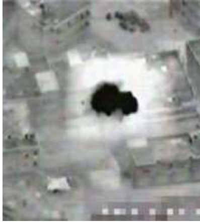
תצלום של פגיעת חימוש מדויק במטרתו, ממצלמתו של כלי טיס של צה"ל