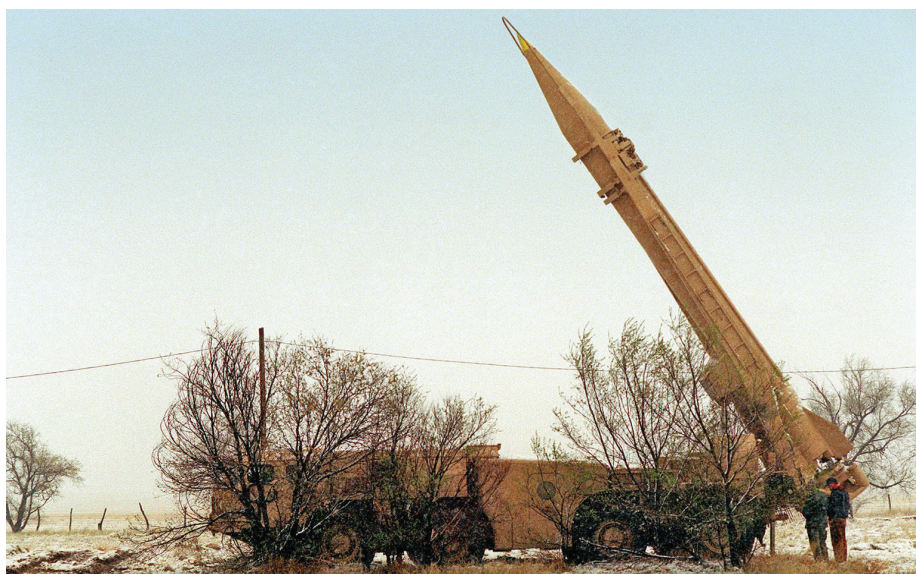
תמונה 1: משגר טילי סקאד

ההגנה האווירית ובחסות ההפחתה הזו יוכלו מטוסינו לפעול ביתר חופשיות. 11 גישת חיל האוויר באה למבחן ביוני 1982, במלחמת לבנון הראשונה. מבצע 'ערצב 19' להשמדת סוללות טילי הקרקע-אוויר הסוריות בבקעת הלבנון היה לסיפור הצלחה היסטורי. הדרך של צבא היבשה, לעומת זאת, לא זכתה להצלחה דומה. רבע מאה אחרי השמדת סוללות הטילים בבקעא, במלחמת לבנון השנייה, נתקלו כוחות היבשה של צה"ל במארב נ"ט בעת חציית ערוץ הסלוקי בדרום לבנון. התופעה של סיני 1973 חזרה על עצמה. כוח משוריין, הפעם מגובה בחי"ר ובארטילריה כלקח המלחמה ההיא, התקשה להתגבר על כוח נ"ט מוסווה, מחופר וערוך היטב. במשך שעות כשלו אפילו הניסיונות לזהות את מקורות הירי ולשבש בארטילריה את המארב שגבה מחיר ועיכב את הכוחות.