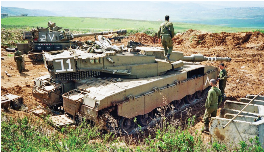
תמונה 2: טנק צה"לי בלבנון 26

הרעיון, אם כן, הוא לנצל את קרבת כוחותינו המתמרנים לאויב, למצות את יכולות החישה ובעיקר גילוי ואיכון שיגורים, להציב במיקום אחורי, אך קרוב, את הטילים הרשתיים, ולתקוף במהירות את מקורות הירי. התנגדות לכוחותינו באמצעים כמו נ"ט, מרגמות, רקטות ואפילו טילי קרקע-אוויר תהפוך מכמעט בטוחה, למסוכנת מאוד. 25 זה מתחיל להיות דומה לרעיון של חיל האוויר לדיכוי טילי הקרקע-אוויר.