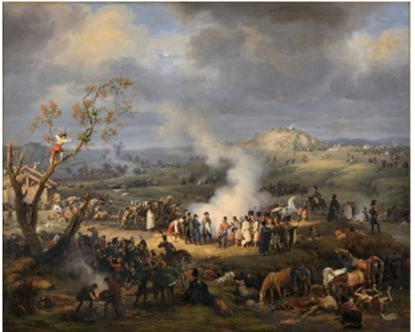
נפוליאון מדרבן את חייליו ערב קרב אוסטרליץ

המחצית השנייה של המאה ה-19 הייתה העידן הגדול של מסילות הברזל [9], אחד הראשונים שהציעו לצבאות ליהנות ממסילות הברזל היה פרידריך ליסט (כלכלן גרמני), שכבר בשנות ה-30 של המאה ה-19 חזה לרשת מסילות הברזל תפקוד חשוב בהעתקת גייסות. אך הראשונים שתפסו את המשמעות הצבאית הטמונה בהצעה זו היו דווקא הרוסים, שבשנת 1846 הסיעו במסילה קורפוס בן 14,500 חיילים, על כל סוסיו ותכולתו, מרחק של יותר מ-320 ק"מ בין ראדיש לקראקאו, בתוך יומיים בלבד. כעבור כמה שנים הלכו בעקבותיהם האוסטרים, הצרפתים והפרוסים. בשנת 1870 (תקופת מלחמת גרמניה-צרפת), שיירות האספקה היו למכונות מרשימות – לכל קורפוס היה גדוד שירותים ובו: 40 קצינים, 84 רופאים, כ-1500 חיילים, כ-3000 סוסים ו-670 קרונות. חלק מהגדוד נע בעקבות הלוחמים (סוסים זרביים, עגלת תרופות וקנטינה ניידת) וחלקו האחר (חוליות טכניות, קרונות מובילים, שדרות מזון ומאפיות שדה, בית חולים שדה, תחמושת ומטען קצינים ומטה הדיביזיה) נע בסוף סדר התנועה. חידוש המטען נעשה באמצעות שליחת הקרונות הריקים לאחור להתמלא. הצבא הפרוסי היה נפרד משיירות האספקה כדי להשיג פריסת כוחות מהירה, כתוצאה מכך המלחמה (עם צרפת) נפתחה ללא הגעת התובלה אל שטחי הכינוס, השיירות לא הצליחו להדביק את הגייסות ובחלק מהמקרים הגיעה האספקה לארמיה רק לאחר שכבר ערכה כמה קרבות. הארמיות שהיו צריכות לקבל אספקה בעזרת ראשי מסילות ברזל בפועל לא הוזנו, כי ראשי המסילות היו דחוסים מכדי שיהיה אפשר להפעילם ביעילות, והצבא הפרוסי ניזון מהפקעות ומהתרמות כפי שעשה ולנשטיין כמאתיים וחמישים שנה לפני כן.