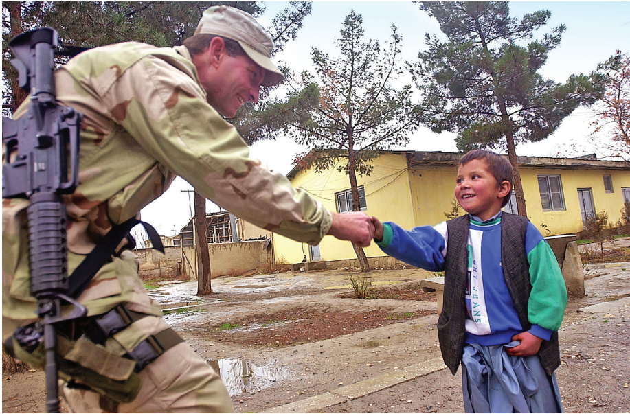
תמונה 1: חייל של צבא ארצות הברית מברך לשלום ילד אפגני מקומי במהלך חג מוסלמי במזרזי-שריף