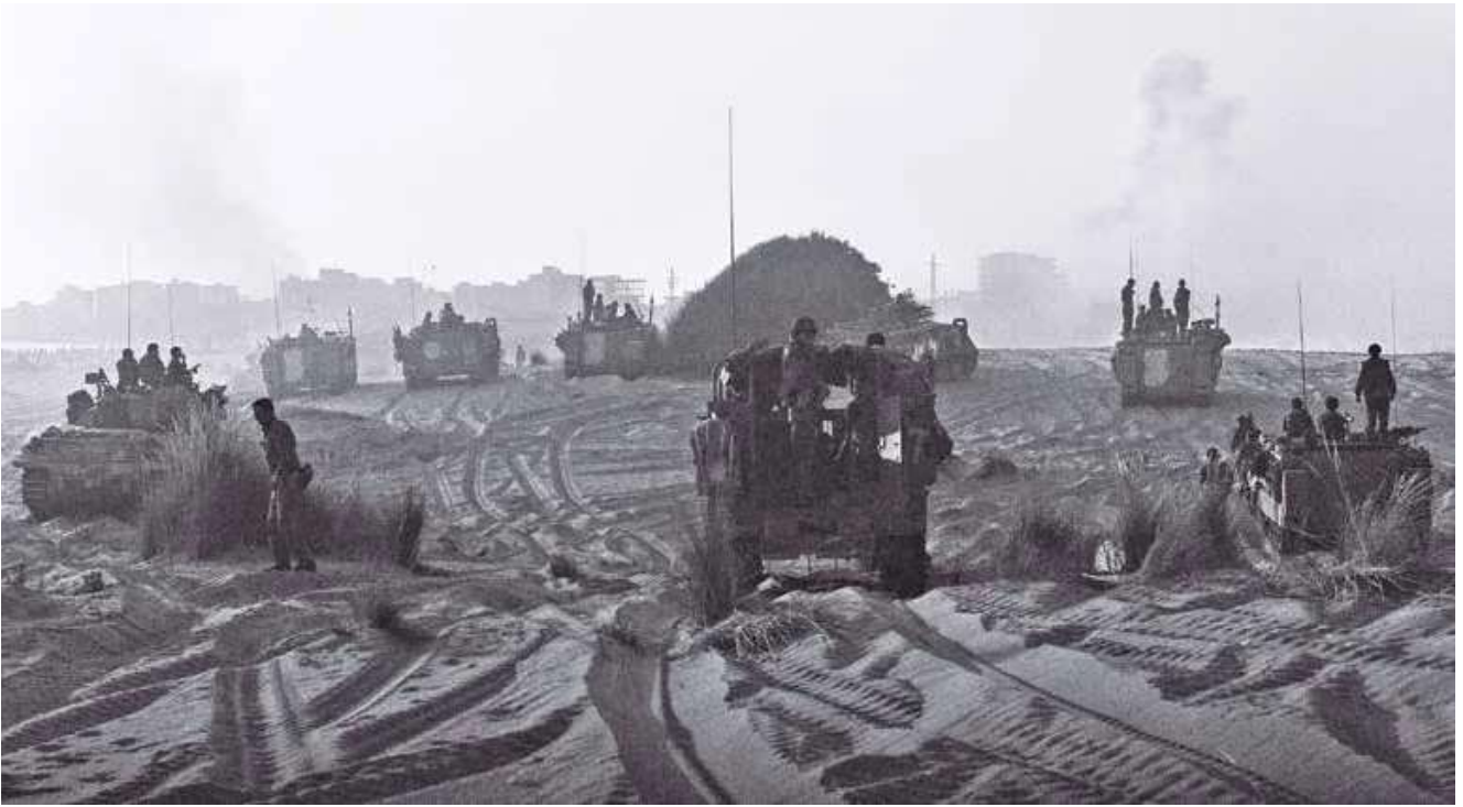
חפ"ק אוגדה 91 מדרום לצור במהלך כיבוש העיר

הירי המקדים עורר מהומה בעיר, ואזרחים רבים החלו לנופף בדגלים לבנים לעבר כוחות צה"ל. בעקבות הירי פנה נציג הצלב האדום אל כוחות צה"ל וביקש לעכב את כניסתם כדי למנוע פגיעה בתושבים ולפתוח במשא ומתן על כניעת העיר. צה"ל התנה את השהיית ההתקפה ביציאת האזרחים מבתי העיר לחוף הים. נציג הצלב האדום, הארכיבישוף של צור וחוקר שבויים מיחידה 504 שנלווה לכוחות צה"ל עברו ברחובות העיר וקראו לתושבים לצאת. בתוך זמן קצר התקבצו אלפים רבים מתושבי העיר בחוף הים, וההתקפה נדחתה. במהלך ההמתנה הוחזר לידי צה"ל חייל שנלקח בשבי יום קודם לכן במהלך קרב באזור מחנה הפליטים אל-ביץ.