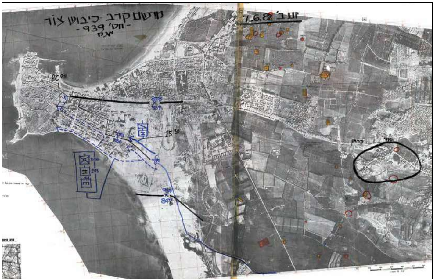
כיבוש צור בידי חטיבה 939, מרשם קרב על גבי תצ"א

הירי המקדים עורר מהומה בעיר, ואזרחים רבים החלו לנופף בדגלים לבנים לעבר כוחות צה"ל. בעקבות הירי פנה נציג הצלב האדום אל כוחות צה"ל וביקש לעכב את כניסתם כדי למנוע פגיעה בתושבים ולפתוח במשא ומתן על כניעת העיר. צה"ל התנה את השהיית ההתקפה ביציאת האזרחים מבתי העיר לחוף הים. נציג הצלב האדום, הארכיבישוף של צור וחוקר שבויים מיחידה 504 שנלווה לכוחות צה"ל עברו ברחובות העיר וקראו לתושבים לצאת. בתוך זמן קצר התקבצו אלפים רבים מתושבי העיר בחוף הים, וההתקפה נדחתה. במהלך ההמתנה הוחזר לידי צה"ל חייל שנלקח בשבי יום קודם לכן במהלך קרב באזור מחנה הפליטים אל-ביץ.