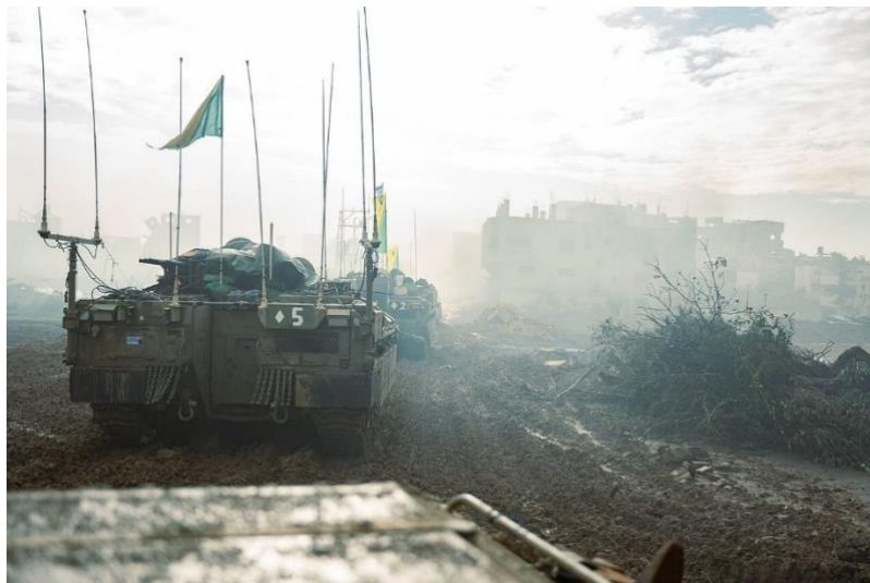
נגמ"שי נמ"ר של חטיבת גולני בשגי'אעיה במלחמת "חרבות ברזל".