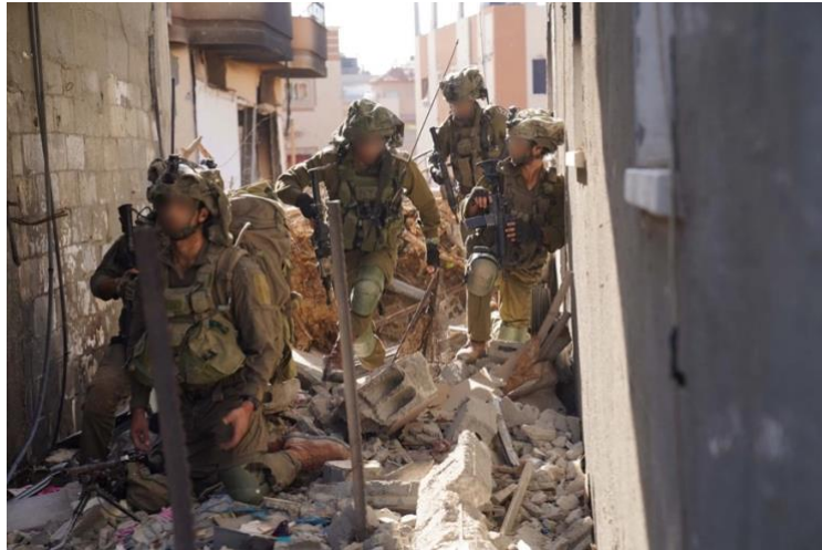
לוחמי אגוז בסמטאות חי'אן יונס (מקור: דובר צה"ל).