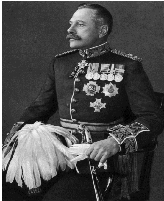
הגנרל הבריטי דאגלס היג

לפי טענתו של היג הפתרון תלוי בכשירות גבוהה של הכוח הצבאי שתאפשר למקבלי ההחלטות לקבוע את התפיסה בזמן אמת. גישה זו פותרת לכאורה את האתגר שבו עוסק מאמר זה, אך קל יותר ליישמה בצבא משלוח המגיע לזירת הלחימה, אחר שזו התחילה, ולכן חלק מאי הוודאות של התפיסה בתקופה שלפני המלחמה מתפזרת, מאשר בצבא הנדרש לפעול באפקטיביות החל מהרגע הראשון, כמו במקרה של המעוזים, או כאשר משאבים מסוימים מצויים במחסור ומיצויים המיטבי מושפע מהותית מהתאמתם (טכנולוגית, תהליכית ומיומנות אישית) לפי תפיסה כזו או אחרת לפני המלחמה. תיאורטית אפשר להציע כי חלק מהאגודות או מהטייסות תפעלנה לפי תפיסה אחת וחלק לפי אחרת, וכי הקביעה מה היא התפיסה הנכונה תוכרע בשדה הקרב בימים הראשונים של הלחימה, ותונחל לחלקים של הצבא שלא פעלו לפיה. הבעיה נעוצה בכך שההיסטוריה של צה"ל מראה כי לא ניתן לחזות מראש באלו ציוותי כוחות תבוצע הפעלת הכוח, ועקב הצורך לצוות כוחות בתחילת לחימה ובמהלכה יישום ההצעה יביא ל"מגדל בבל" כבר בדרג האוגדה.