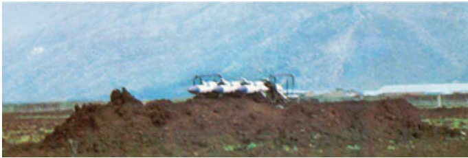
משגר טילים מסוג S.A.-6 ליד כביש ביירות-דמשק, הצופה לבקעת הלבנון, תחילת 1982.