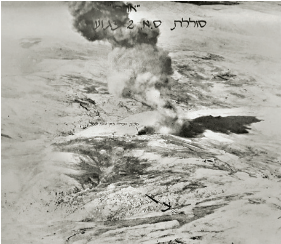
פגיעה במכ"ם סוללת S.A.-2.

נקיים ממטוסי אויב, כך שמבצע תקיפת הטק"א יקבל את כל הנדרש לביצועו. סלע התמקד בלחימה בטילים, ולא היו לו סמכויות או אחריות על כל יתר המשימות, שנוהלו כאמור על ידי עברי. התארגנות פו"ש ייחודית זו הצדיקה את עצמה, שכן תוך כדי תקיפת הטק"א הפעילו הסורים עשרות מטוסי קרב כדי לסייע לסוללות המותקפות. בקרבות אוויר-אוויר (בהקשר ישיר ל"ערצב 19"), אותם ניהל עברי, יורטו על ידי מטוסי קרב ישראליים שהמתינו להם כעשרים מטוסי קרב סוריים. 101 למכלול החלטות פיקודיות אלו הייתה השפעה משמעותית על הצלחת מימושה של היכולת שפותחה בשנים שלפני מבצע "ערצב 19".