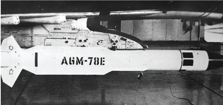
טיל מונחה קרינת מכ"ם - "אגרוף סגול".

והטילים נותרו ללא מטרות. טיל אחד התביית על סוללה סורית באזור דמשק, פנה חדות מזרחה ופגע בה. 79