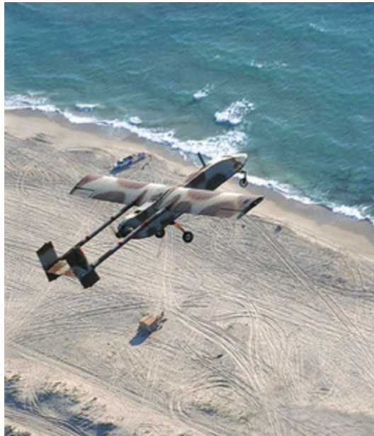
מזל"ט זהבן. (אתר חיל האוויר)

בעדותו כי בשבת, 24 ביולי 1982, נעשה שימוש אינטנסיבי במזל"טי "זהבן" לתקיפת סוללות S.A.-8 שהסורים החלו להכניס ללבנון. 44 לא ניתן היה להעביר בזמן אמת תמונה למטוס התוקף, אלא רק למפקדת חיל האוויר אשר הנחתה את הטייס. 45 איסוף בזמן אמת נעשה באותה תקופה בעיקר באמצעות מודיעין אותות (אלינט), על ידי מטוסי "בואינג" 707 שהוסבו בחיל האוויר למטוס אלינט מעופף ("ראם"). גם המידע האלינטי הגיע לצמ"א ולתשל"ם. יצחק אמיתי ציין לימים כי בתחילת שנות השמונים נעשה ניסיון לצמצם את אליפסת האלינט על ידי שילוב אמצעי איכון מסוגים שונים, ולשלב איכון זה עם היכולת של מצלמת הטלוויזיה לסרוק תא שטח קטן. השילוב הזה נדרש גם לאיכון הסוללות וגם לצורכי בדיקת תוצאות התקיפה לאחר גל התקיפה הראשון. 46 איכון הסוללות ובדיקת תוצאות התקיפה נעשו גם בסיועה של יחידה יבשתית שחיל האוויר הקים לצורכי תצפיות מיוחדות (תצ"ם) - יחידה 5707 שהוקמה לצורך כך ב-1974. 47