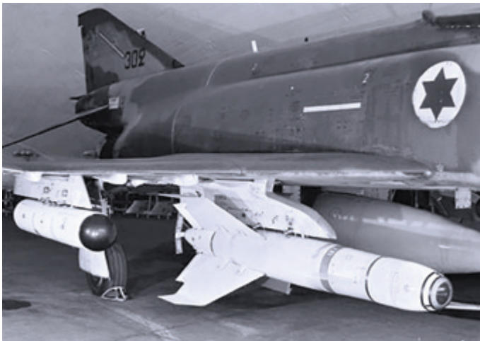
פצצת תדמית מדגם מוקדם על "קורנס".

הטילים האלקטרו-אופטיים היו טילי "תדמית" של רפא"ל ("אגרוף חום") והפצצות האמריקאיות מונחות הטלוויזיה ("אגרוף ירוק"). היה גם "אגרוף צהוב" - פצצת (AGM 62) Walleye אמריקאית רגילה (שנקראה בצה"ל "תשקיף"), שנערכו בה שינויים לצורך הארכת הטווח ולצורך הנחיה.