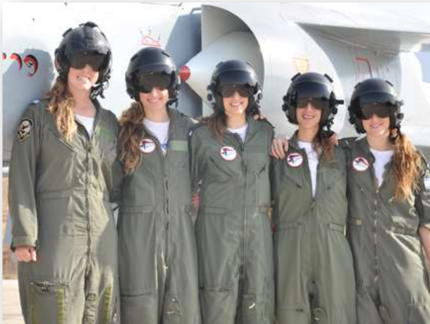
בוגרות קורס טיס