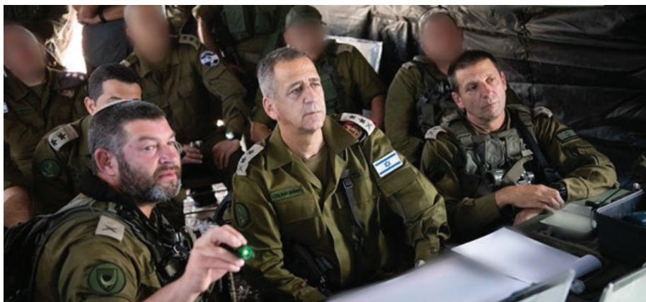
במרכז: הרמטכ"ל כוכבי בתרגיל, הסביר שהצבא יפעיל תמרון רב־ממדי, מהלומות אש והגנה רב־ממדית חזקה, (צילום: דובר צה"ל)

בנאום כניסתו לתפקיד, ב־15 בינואר 2019, הציג הרמטכ"ל הקודם, אביב כוכבי, את חזונו, והדגיש במרכז הדברים: "הגדלת כושר הפגיעה באויב, והעמדת