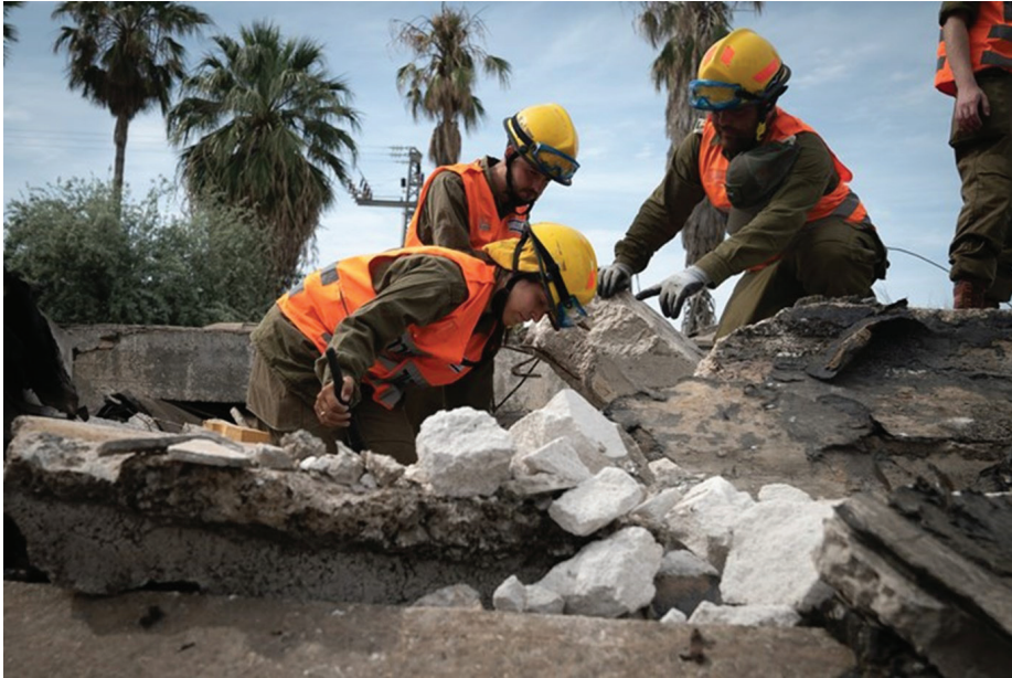
כוחות פיקוד העורף בתרגיל חילוץ נפגעים מביניין שקרס, (צילום: דובר צה"ל).

זהו התחום שבו צה"ל מקיים מאמץ מתמשך לתיאום ציפיות עם הציבור הישראלי, בעיקר באמצעות מפקדי פיקוד העורף. הראיונות בתקשורת עם מפקדי העורף, אלוף יאיר גולן (שלח, 2011), אלוף אייל אייזנברג (כספית ואמיר, 2015) ואלוף יואל סטריק (לימור, 2017) כללו כולם את הצגה של הערכתם לגבי הנזק שייגרם לעורף במלחמה רחבת-היקף עם חזבאללה ואזהרה לציבור כי יכולת ההגנה על העורף בעת מלחמה כזו תהיה נמוכה מזו שהייתה במערכות המוגבלות בעזה. מפקד פיקוד העורף בשנים 2020–2022, אלוף אורי גורדין, אמר במרץ 2021: "תרחיש הייחוס במלחמה הבאה – 2,000 טילים ביום" (ערוץ 7, 2022).