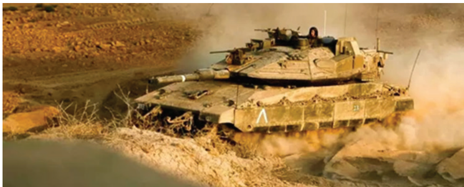
טנק בגזרת עוטף עזה במהלך מבצע "עלות השחר"