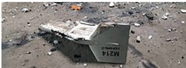
שרידי כטמ"ם "שאהד-136" מתוצרת איראן בחרקוב, אוקראינה (מקור: ויקיפדיה).