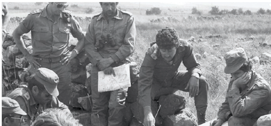
הרמטכ"ל כוכבי והמטה הכללי בהערכת מצב במהלך מבצע "שומר חומות".

אלא הדבר מאפשר רק סיכויים טובים יותר לאכיפה פוליטית (ולכן גם זמנית) של רצוננו על האויב.