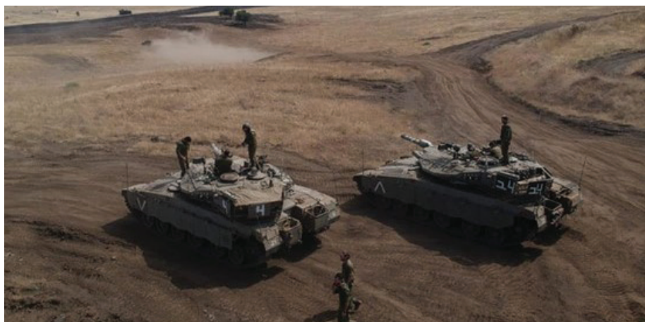
היחידה הרבממדית בתרגיל בצאלים, (צילום: דובר צה"ל).

הדרך היחידה שתאפשר לצה"ל לשחרר משאבים "תל"אביביים" למשימות המעגלים הרחוקים היא הפחתה דרמטית של התלות בהם במלחמות שבמעגל הראשון. לשנות את דפוס מלחמות השפע ולשחרר חלק ניכר מהמפעל התל"אביבי להתמקדות באיום העיקרי החדש.