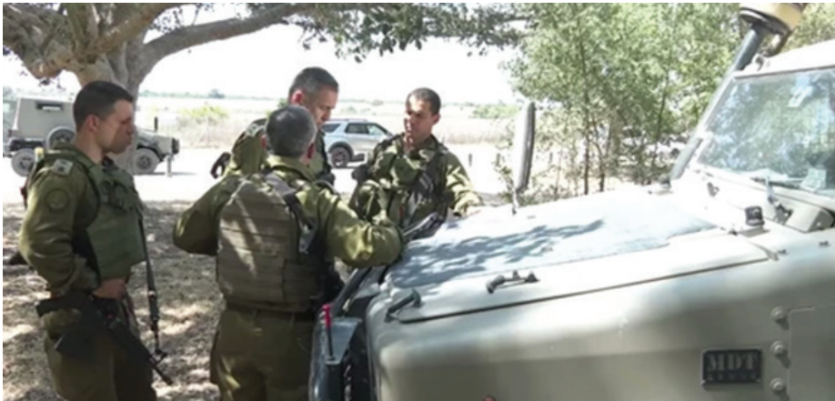
הרמטכ"ל כוכבי בסיור בגזרת עוטף עזה במבצע "עלות השחר" הרמטכ"ל כוכבי בסיור בגזרת עוטף עזה במבצע "עלות השחר".

ישראל השכילה הפעם להפוך את הקערה ולקחת את היוזמה (שהיא כידוע, משחק סכום־אפס) לידיה, אך היו גם מערכות שבהן היתה היוזמה בידי האויב, והדבר הקשה על צה"ל לפגוע בו ביעילות דומה. יש לזכור שמה שהיה הוא לא בהכרח מה שיהיה. לכן, עם סיום המערכה, ומתוך חשש שהצלחת המבצע "תעוורר" אותנו ל"פילים שבחדר", ראוי לתת עליהם את הדעת.