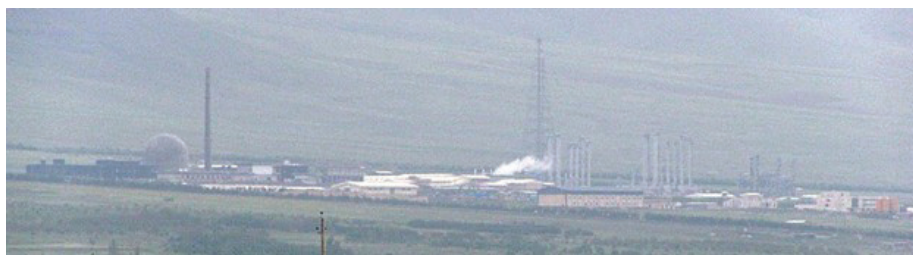
המתקן באראק לייצור מים כבדים.

מה אפשר ללמוד מתקדימים אלה על "נקודת האל־חזור" בהקשר המזרח תיכוני? לא ניתן להקיש ישירות מן התקדים המעצמתי למסלול ההתפתחות העתידי של סכסוך גרעיני ישראל–איראני, בין השאר משום שמערך הטילים האיראני מפותח בהרבה בהשוואה לזה של מעצמות העל לפני שבעים שנה, ואילו פגיעותה של ישראל למתקפת־נגד גרעינית גדולה לאין שיעור מזו של מעצמה יבשתית. במקרה הישראלי, ייתכן אף ש"נקודת האל־חזור" המבצעית כבר נחצתה, עוד לפני שהאיראנים הגיעו בכלל ליכולת גרעינית צבאית, זאת בזכות הארסנל הקונבנציונאלי העצום של חזבאללה – המזכיר את משוואת ההרתעה הקונבנציונאלית שמציבה צפון קוריה מול הדרום. מנגד, העובדה שנשיא אמריקאי הרהר באפשרות ליזום מלחמת מנע מול מעצמה גרעינית שזה עתה פיתחה פצצת מימן מלמדת שיש איומים שהסרתם עשויה להצדיק, לפחות בעיני מנהיגים מסוימים, תשלום מחירים כבדים מאוד. במובן זה, אפשר שנקודת האל־חזור המבצעית נמצאת עוד הרחק לפנינו: העליונות המיוחסת לישראל בתחום הגרעין, בצירוף יתרונותיה באוויר, במודיעין ובתחום ההגנה מפני טילים, ותותר את חלון ההזדמנות לפעולה צבאית פתוח שנים רבות אל תוך העידן הגרעיני של המזרח התיכון.