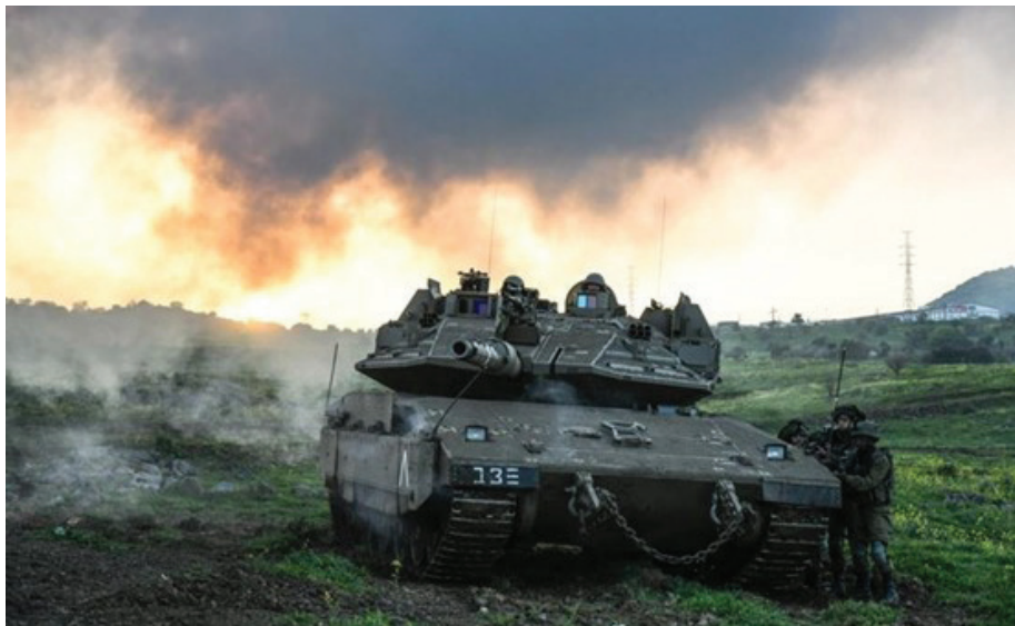
כוח שריון בתרגיל.

כאמור, מאמר זה מתייחס לתרחיש של מלחמה כוללת מול חזבאללה – מלחמה שבה ישראל תידרש להפעיל את כל עוצמתה הצבאית והלאומית. החלטה כזו תתקבל כנראה לאחר תהליך של הסלמה ותוך לבטים רבים, אולם מרגע שתתקבל, הנחת העבודה במאמר זה היא כי יעדיה של ישראל יהיו להסיר את האיום של חזבאללה לשנים רבות (עשור ומעלה). הישגים מוגבלים הכוללים את המושג 'הרתעה' אינם ניתנים לכימות ונתונים תמיד לפרשנות של שני הצדדים, ומאמר זה לא יעסוק בהם.