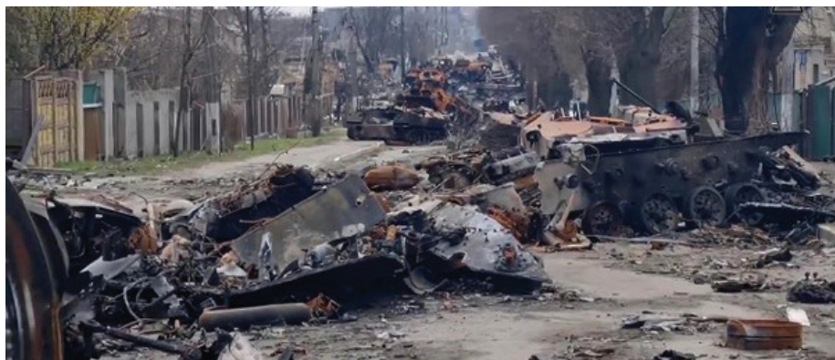
שיירה של הצבא הרוסי שהושמדה בידי הצבא האוקראיני בקרב על בוצ'יה בפברואר 2022