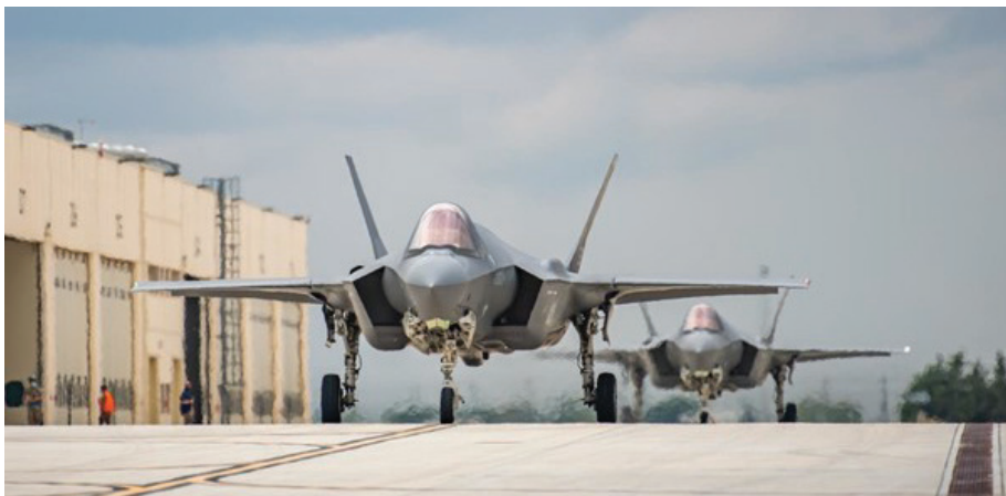
מטוסי אדיר של חיל האוויר

שלב מתקדם יותר של מימוש תשלובת המודיעינית-תקיפה הוא ביצירת השפעה מערכתית ואסטרטגית באמצעות תקיפה מדויקת בהיקף נרחב מאוד. הוא שונה מהשלב הראשון ("תקיפה מדויקת") בכך שהוא מכוון כנגד מערכים שלמים של מטרות (ולא כנגד אוסף מצטבר של מטרות מסוגים שונים) ובכך שהוא דורש מלאים גדולים מאוד של חימוש מדויק. הרעיון של "מהלומה מדויקת" הוא לפגוע במגוון רחב של מערכים בקבועי זמן קצרים יחסית. יישום ראשון של הרעיון הזה ברמה האסטרטגית היה כנראה בגישה של "הלם ומורא" (Shock and Awe) שהתפתחה בארה"ב במחצית השנייה של שנות ה-90.