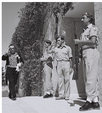
ציר איראן בישראל, רזא סאפינייה, מגיע לבית הנשיא חיים ויצמן ברחובות ביום העצמאות, 1950, (מקור: ויקיפדיה).

המהפכה באיראן ב־1979 שינתה מהיסוד את מדיניותה של איראן כלפי מי שקודם לכן היו בעלי בריתה המרכזיים נגד הלאומיות הערבית הרדיקלית. עם זאת, לא 1979 מכוננת את מערכת היחסים הקיימת בין ישראל לבין איראן, אלא דווקא הרדיקליזם הערבי של נאצר.