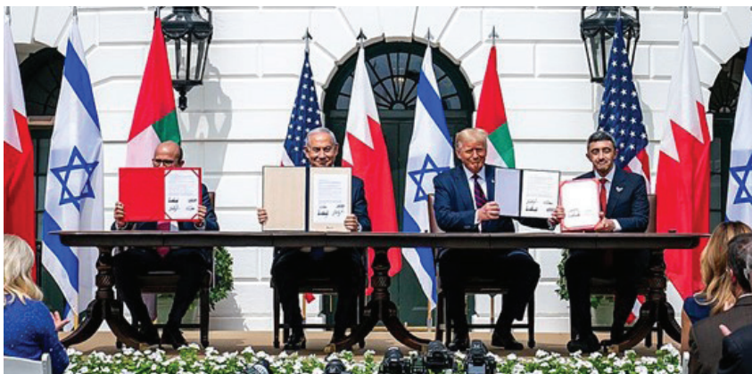
טקס חתימת הסכמי אברהם בבית הלבן. מימין לשמאל: שר החוץ של איחוד האמירויות הערביות, שיחי עבדאללה בן זאיד אאל נהיאן, נשיא ארצות הברית, דונלד טראמפ, ראש ממשלת ישראל, בנימין נתניהו ושר החוץ של ממלכת בהריין, עבד א-לטיף א-זיאני