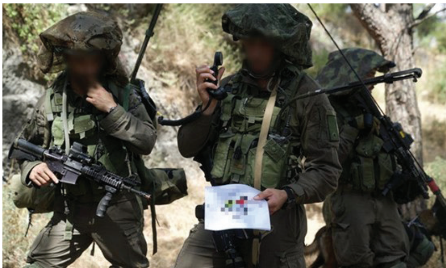
כוח צה"ל באימון שדימה מלחמה בלבנון

בתום כהונה של שנתיים כמפקד פיקוד הצפון, ענה אלוף יואל סטריק לשאלה איך תיראה המלחמה הבאה את התשובה הבאה: "מדממת. אין לי ספק שהמרחב הצפוני יחטוף את היקפי האש הגדולים ביותר, בעיקר באזורי הגבול – יישובים, מוצבים, עמדות בקו הגבול. תשתיות, זה יהיה המרכיב המשמעותי ביותר בתוכנית הפעלת האש של חזבאללה במלחמה הבאה, ולכן זה יהיה שונה מכל מה שקרה בדרום או ב'צוק איתן' או במערכות קודמות. זה לא מתכתב באותם ממדים ולא באותן עוצמות. זה ארגון אחר לגמרי" (בוחרוט, 2019).