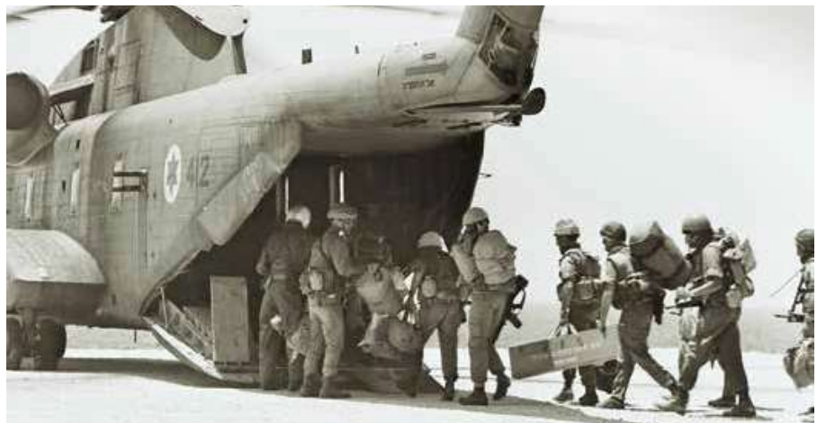
חיילי חי"ר עולים על מסוק יסעור בדרכם לתגבר את כוחות צה"ל בביירות