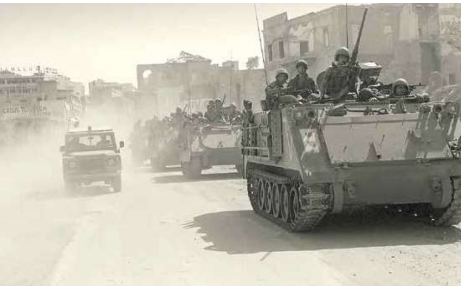
טיהור ביירות המערבית - טור נגמשי"ם לצד ג'יפ שיטור לבנוני

במאמץ הצפוני קיבלה חטיבה 828, בהרכב שלושת גדודיה, 17, 450 ו־906, תחת פיקודה את גדוד 12, שתחת פיקודו פלוגת הנדסה מגדוד 601 ופלוגת טנקים מחטיבה 500, והתקדמה בציר החוף 'בוקיטו', מהנמל לעבר ראס ביירות. בשעה 14:00 הועברה החטיבה תחת פיקוד אוגדה 91 ונקבע גבול גזרה בין שתי האוגדות, וכך השטח שמצפון לציר 'גופמנה' היה באחריות אוגדה 91, והשטח שמדרום לו היה באחריות אוגדה 96. תחת האוגדה