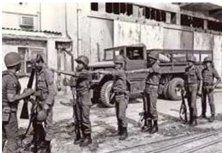
למעלה: חיילי צבא לבנון נפרסים בגמל ביירות עם העברת השליטה על הנמל מידי צה"ל לכוחות הצבא הצרפתי, 21 באוגוסט 1982

הלחץ הגובר על המחבלים הוביל לקידום ההידברות. בליל 12-13 באוגוסט הושגה הסכמה של יו"ר אש"ף יאסר ערפאת על יציאת כוחות המחבלים והכוחות הסוריים מביירות. כדי לאפשר את יציאת המחבלים הוחלט כי יוצב כוח רב-לאומי ובו חיילים מארה"ב, מצרפת ומאיטליה שישהה בביירות וילווח את פינוי המחבלים, וכמו כן הוחלט כי המחבלים יוכלו לעזוב את ביירות כשכל אחד מהם נושא כלי נשק אחד ושאר אמצעי הלחימה יימסרו לצבא לבנון. אוגדה 96 קיבלה אחריות לניהול המבצע מבחינת אבטחת המרחב, ואוגדה 162 אבטחה את ציר ביירות-דמשק בגזרתה ואת מעבר המפונים שנעו בו מזרחה. ב-21 באוגוסט החל פינוי המחבלים והכוחות הסוריים מביירות, והוא הושלם ב-31 באוגוסט. בסך הכול התפנו כ-8,500 מחבלים וכ-6,000 חיילים סורים.