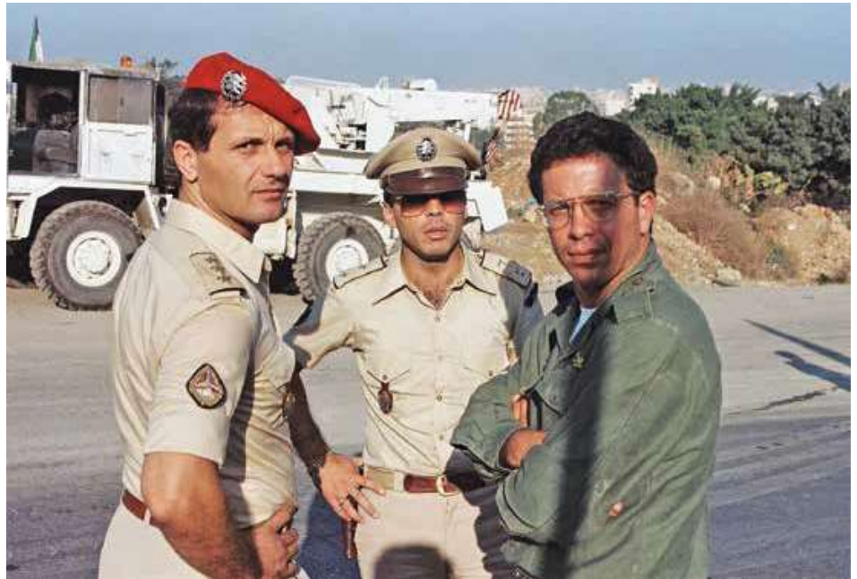
למעלה: תת-אלוף יוסי בן-חנן בפגישת תיאום עם קצינים מצבא לבנון למעלה משמאל: חיילים צרפתים בנמל ביירות, 21 באוגוסט 1982