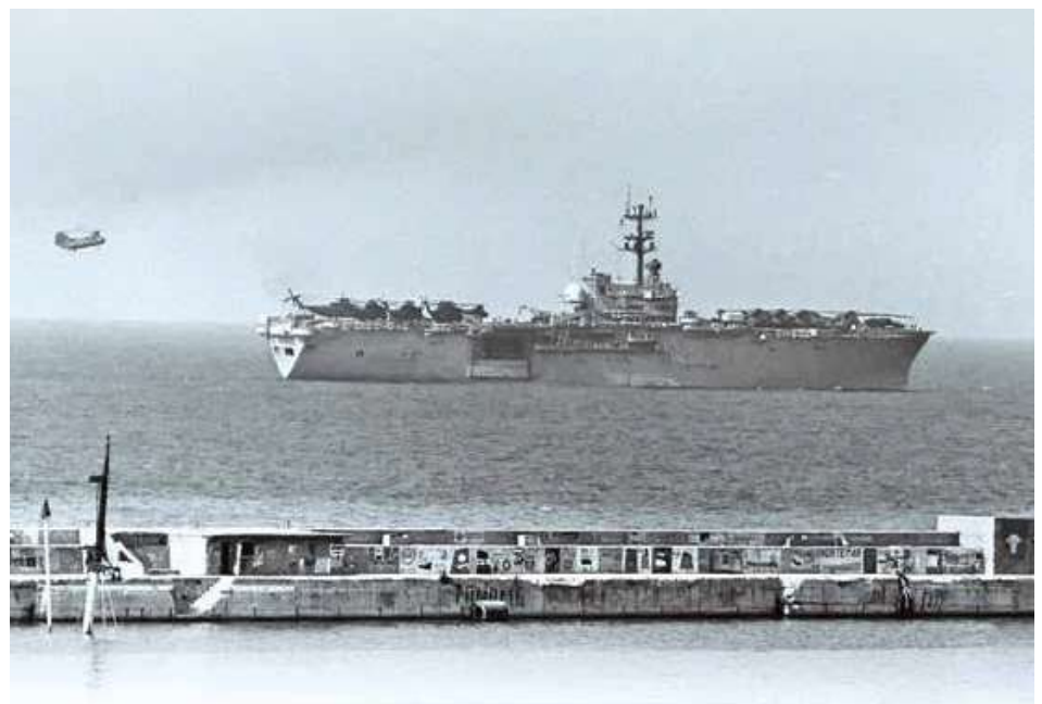
נושאת מסוקים מדגם איוו ג'ימה בשירות חיל הנחתים האמריקאי, כחלק מהכוח הרב-לאומי בלבנון, סמוך לנמל ביירות