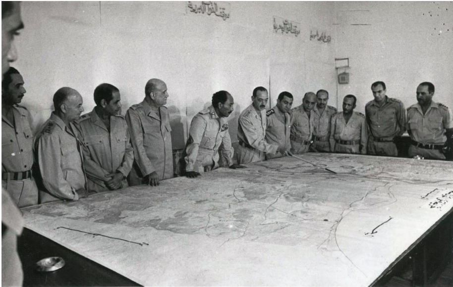
הנשיא המצרי סאדאת בדיון עם המטה הכללי המצרי במלחמה, (מקור: ויקיפדיה).