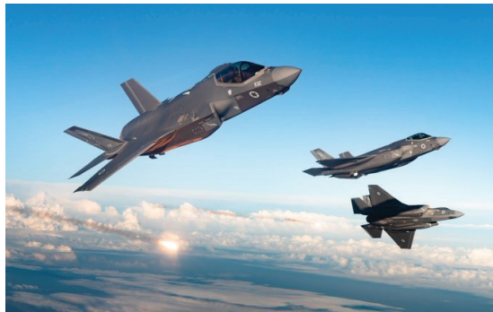
מטוסי קרב F-35 של חיל האוויר באימון.