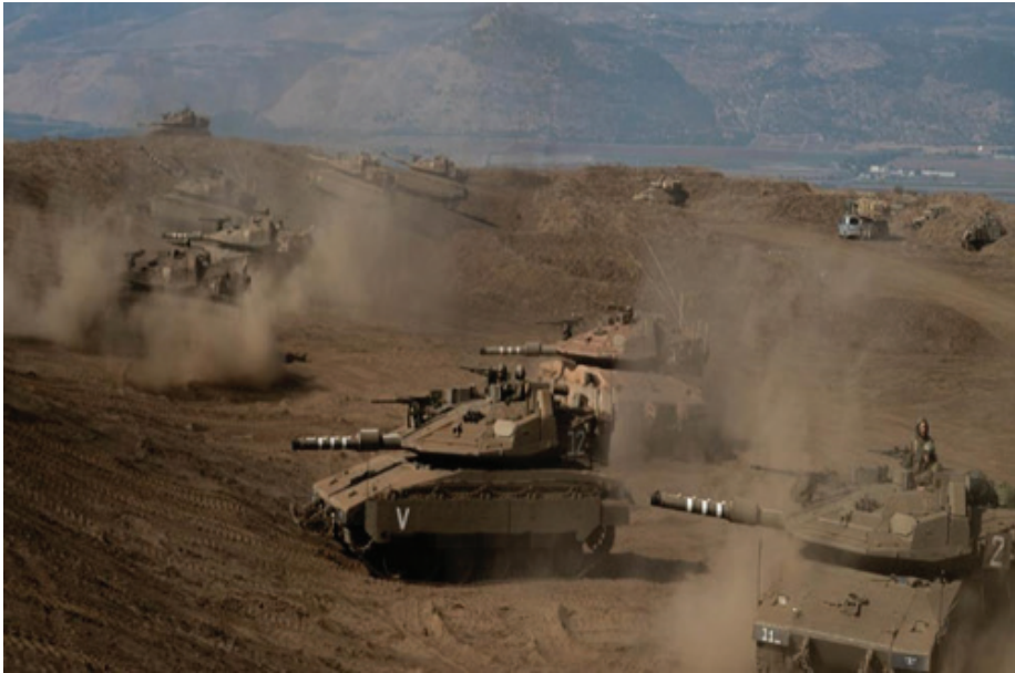
גדוד שריון מחטיבה 7 באימון ברמת הגולן, (צילום: דובר צה"ל).

מהטנקים ומהנגמ"שים, אך חלק מהכוח עודו פגיע. יכולות האיתור ותקיפת כוחות הנ"ט נותרו מוגבלות ותלויות מאוד בסיוע מודיעיני ואווירי. ב־1973 מגנני הנ"ט החזיקו ברצועת החוף הצרה שממזרח לתעלה. הפתרון, בסופו של דבר, היה לעקוף ולכתר אותם. ב־2023 מגוון הנ"ט המתקדם של האויב על מערכי שיגור הטילים והרקטות לעורף ישראל. האם עקיפת הבעיה היא עדיין מענה רלוונטי?