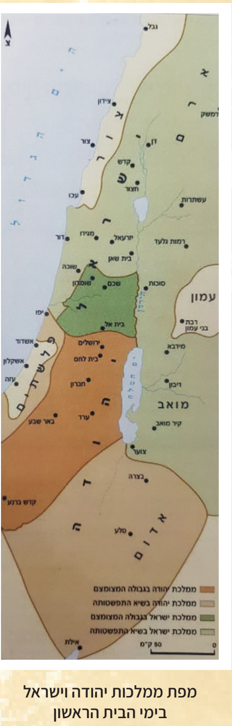
מפת ממלכות יהודה וישראל בימי הבית הראשון