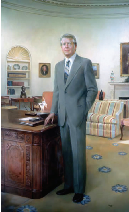
הציור הרשמי של הנשיא ג'ימי קרטר, 1980 (צייר: רוברט טמפלטון) 5

במהלך השיחות בין ישראל לבין מצרים שהחלו לאחר תום מלחמת יום הכיפורים, איימו האמריקאים לעכב את משלוחי הנשק לצה"ל בכל פעם שפרץ משבר בשיחות.