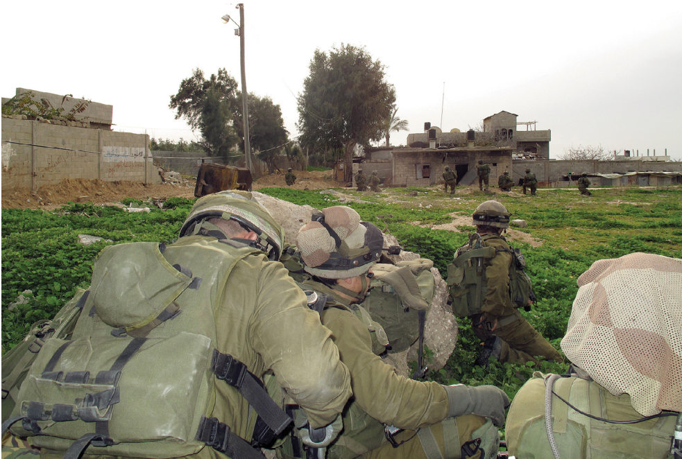
לוחמים ברצועת עזה.

אוגדה שרואה את האתגרים בגזרתו, כמו תמיר, נדרש להיאבק על הקשב ועל הזמן של מפקדיו ושל פקודיו (ופקודיו הצפויים במבצע) כדי להכניסם. מפקד האוגדה יכול לזהות ולפתח תפיסה מעולה, אך היכולת להנחילה גם מחוץ לאוגדה חשובה מאוד להצלחה המבצעית. תמיר התמודד מול אתגרים נוספים שהטרידו את צה"ל באותו הזמן, לדוגמה, מוכנות למלחמה בצפון. 39 הוא זכה לשיתוף פעולה מצד מפקד הפיקוד שהניע תהליכים להסדרה מול המטכ"ל, הפצ"ר, השב"כ ועוד, ואף דחף לקדם את המוכנות ברמת היחידות. 40