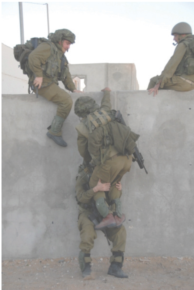
לוחמים באימון בצאלים.