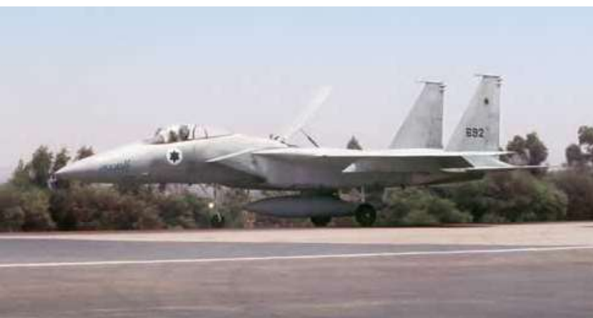
מטוס קרב בז (אף-15)

בשבוע הראשון למלחמה עד 11 ביוני נערכו 3,569 גיחות קרב ו-977 גיחות אחרות. מבין גיחות הקרב היו 2,643 גיחות לסיוע ולאמנעה ו-1,311 לפטרול יירוט.