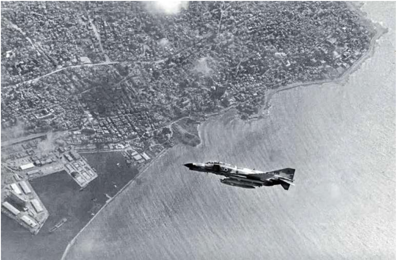
מטוס קורנס מעל נמל ביירות

למטה: מסוק קרב צפע (יואי קוברה) בתחתית העמוד: מטוס קרב שחק (מיראז' 3)