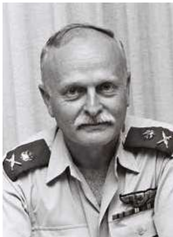
מפקד חיל האוויר, אלוף דוד עברי

בשנים שמאז מלחמת יום הכיפורים התפתח חיל האוויר במהירות, והגיע למבצע 'שלום הגליל' כשברשותו סדר כוחות גדול ומתקדם. ב־4 ביוני 1982 כלל מערך הקרב 607 מטוסים, 459 מהם היו שמישים. מבין המטוסים המתקדמים ביותר היו 39 מטוסי בז (אף־15) ו־71 מטוסי נץ (אף־16). נוסף אליהם היו 212 מטוסי עיט (סקייהוק), 137 קורנס (פנטום), 122 כפיר, 21 שחק (מיראז') וחמישה מטוסי נשר. בשנים שקדמו למבצע החל החיל לקלוט מסוקי קרב מדגם צפע (יואיי־קובר) ולהטוט (דפנדר), ולרשותו עמדו 41 מסוקים, 27 מהם היו שמישים (מתוכם רק חמישה צפעים, שנשאו חימוש רב ומגוון יותר מהלהטוטים, שחומשו בארבעה טיילי טאו בלבד). לחיל האוויר היו גם 142 מסוקי תובלה, בין היסעור הכבד והסייפן הקל, 101 מהם שמישים, ו־116 מטוסי תובלה, 88 מהם שמישים. נוסף על קליטת מטוסים מתקדמים, בשנים שלאחר מלחמת יום הכיפורים בחיל האוויר נעשו מהלכים נוספים, ובהם קליטת חימושים מדויקים, ואמצעי איסוף מודיעין מתקדמים, בהם מטוסים זעירים ללא טייס (מזל"טים) מתוצרת ישראל, שהיו יכולים לספק מודיעין מדויק בזמן אמת. מאמץ מיוחד הושקע בפיתוח מענה לאיום טילי הקרקע־אוויר, שהקשו על פעולת החיל באוקטובר 1973. המענה שנמצא לאתגר היה איתור סוללות הטילים באמצעים שונים ותקיפתן באמצעות חימושים מדויקים תוך הרוויית מערך ההגנה באופן שישבש את פעולתו.