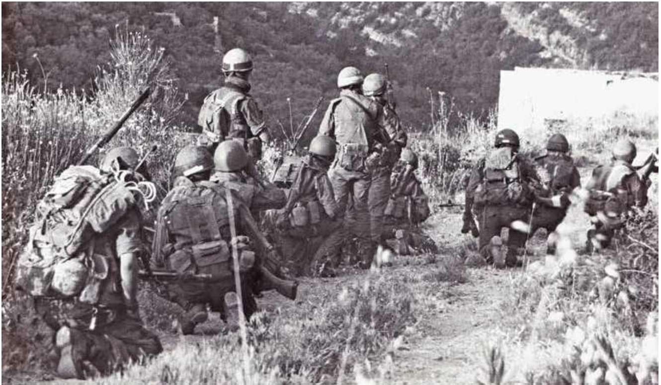
לוחמי נח"ל מוצנח במרדף אחרי חוליות מחבלים בעיירה דיר אל-קמאר, יולי 1982

לסרוק את השטחים שנכבשו, לאתר מצבורי אמצעי לחימה ולצד זאת לסייע לאוכלוסייה האזרחית שנמצאה בהם.