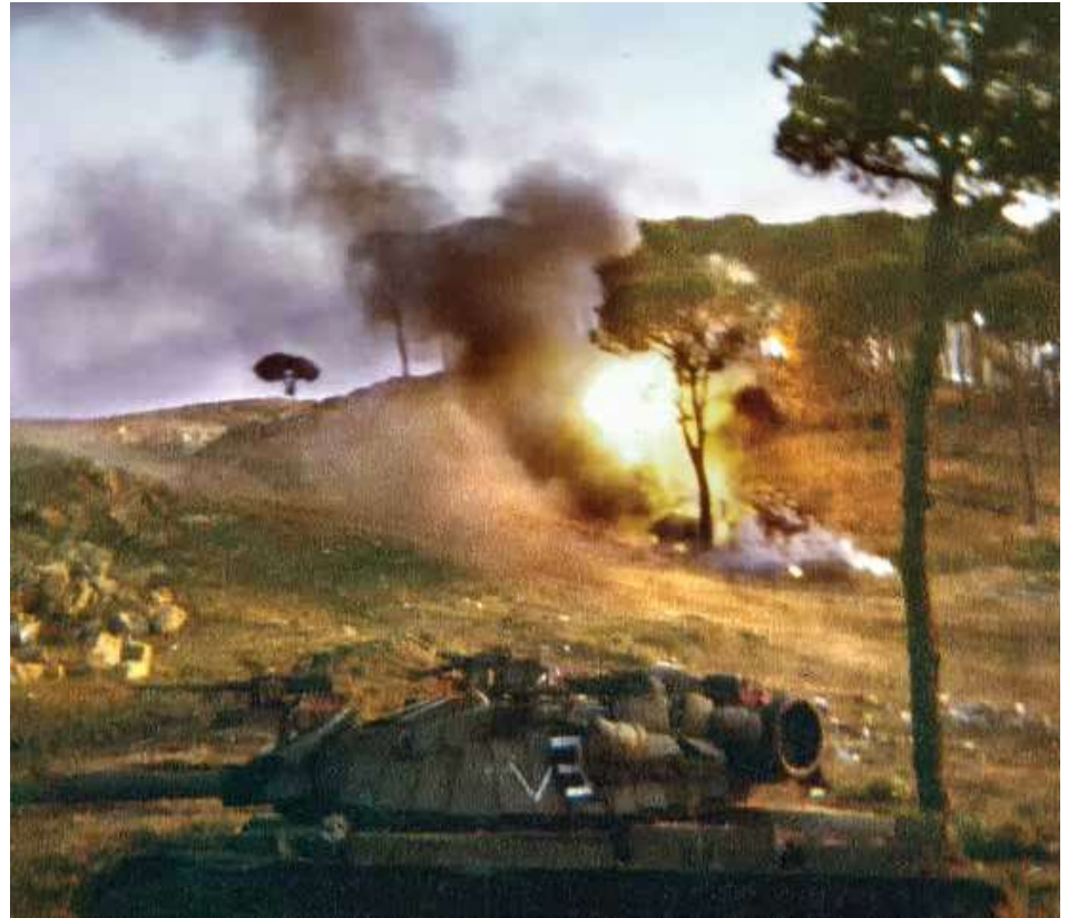
מימין: טנק מחטיבה 500 באזור רויסת צופר, סמוך לכביש ביירות-דמשק, ברקע משאית תחמושת סורית העולה באש, 24 ביוני

חטיבה 828 תכבוש את עאליי ואת סוק אל-ערב. תכנון אוגדה 162 היה שחטיבת גולני תתקדם צפונה ותתפוס עמדות שולטות מדרום לכביש, בג'בל א-רציף ('סגול 6125') ובמקלעת דבעה, ממזרח וממערב לכפר בחמדון. בעקבות חטיבת גולני תתקדם חטיבה 500 ותשלט על המרחב שבין רויסת צופר לבחמדון. הרעיון המבצעי היה להגיע אל כביש ביירות-דמשק, דרך 'ציר העמודים', שבין מנצוריה לציר 'אהרונסון', ובכך לעקוף את בחמדון ממזרח ולהימנע מקרבות בתי הכפר. משעות הצהריים התקדמו כוחות חטיבה 500 לעבר כביש ביירות-דמשק, כאשר גדוד 195 מוביל את ההתקפה, תוך ירי ארטילרי לעבר הרכסים השולטים על כביש ביירות-דמשק. כמה דקות לאחר השעה 18:00 התייצבו הכוחות הראשונים של גדוד 195 על כביש ביירות-דמשק ובכך הושג היעד המערכתי בגזרה המרכזית. בעקבות הגדוד התקדמו למרחב שאר כוחות חטיבה 500 וחטיבת גולני למרחב, נערכו להגנה בשטחים השולטים על הכביש והתארגנו לקראת המשך לחימה. חטיבת גולני התקדמה בשעות הערב לציר ביירות-דמשק ופנתה מערבה עד מצפון-מערב לבחמדון ('מתג 13') על הציר הסמוך לנ"ג 1100 שממנו ניתן לשלוט היטב על התנועה בציר.