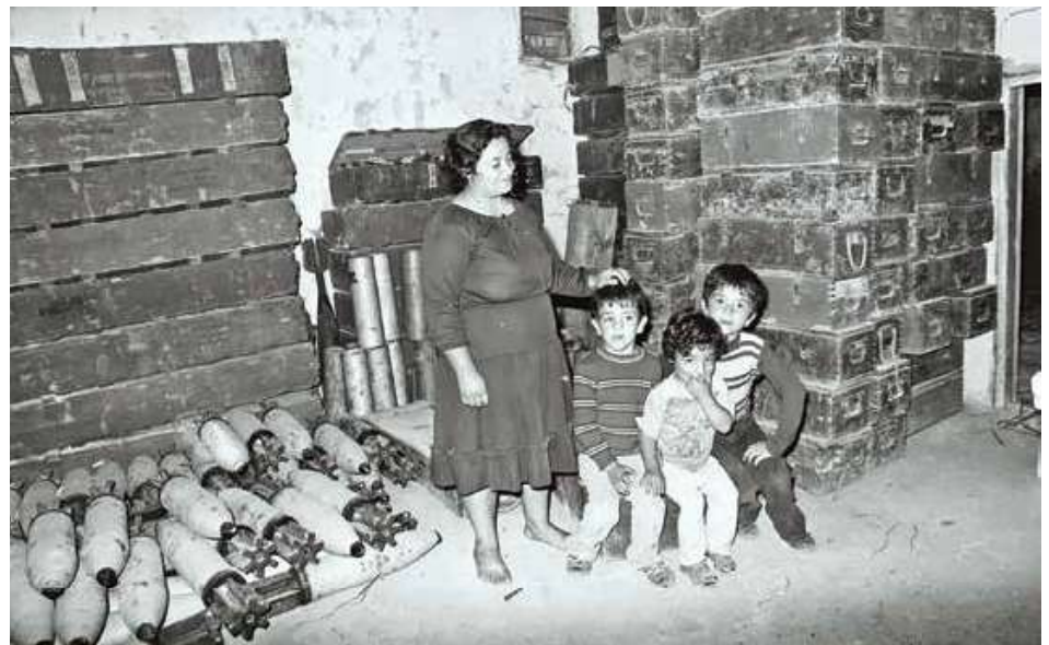
מימין: בונקר תחמושת בבית משפחה לבנונית