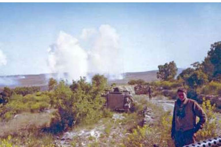
למעלה: גדעון אברמי, מפקד פלוגה בגדוד 195; ברקע - התקפה ארטילרית על מנצוריה

למעלה מימין: מנצוריה - טנקי פלוגה כ' של גדוד 195 מחטיבה 500 על הגבעה המסולעת. העשן ברקע עולה מנגמ"ש פגוע של כוח מחטיבת גולני שנפגע בהפגזת מרגמות