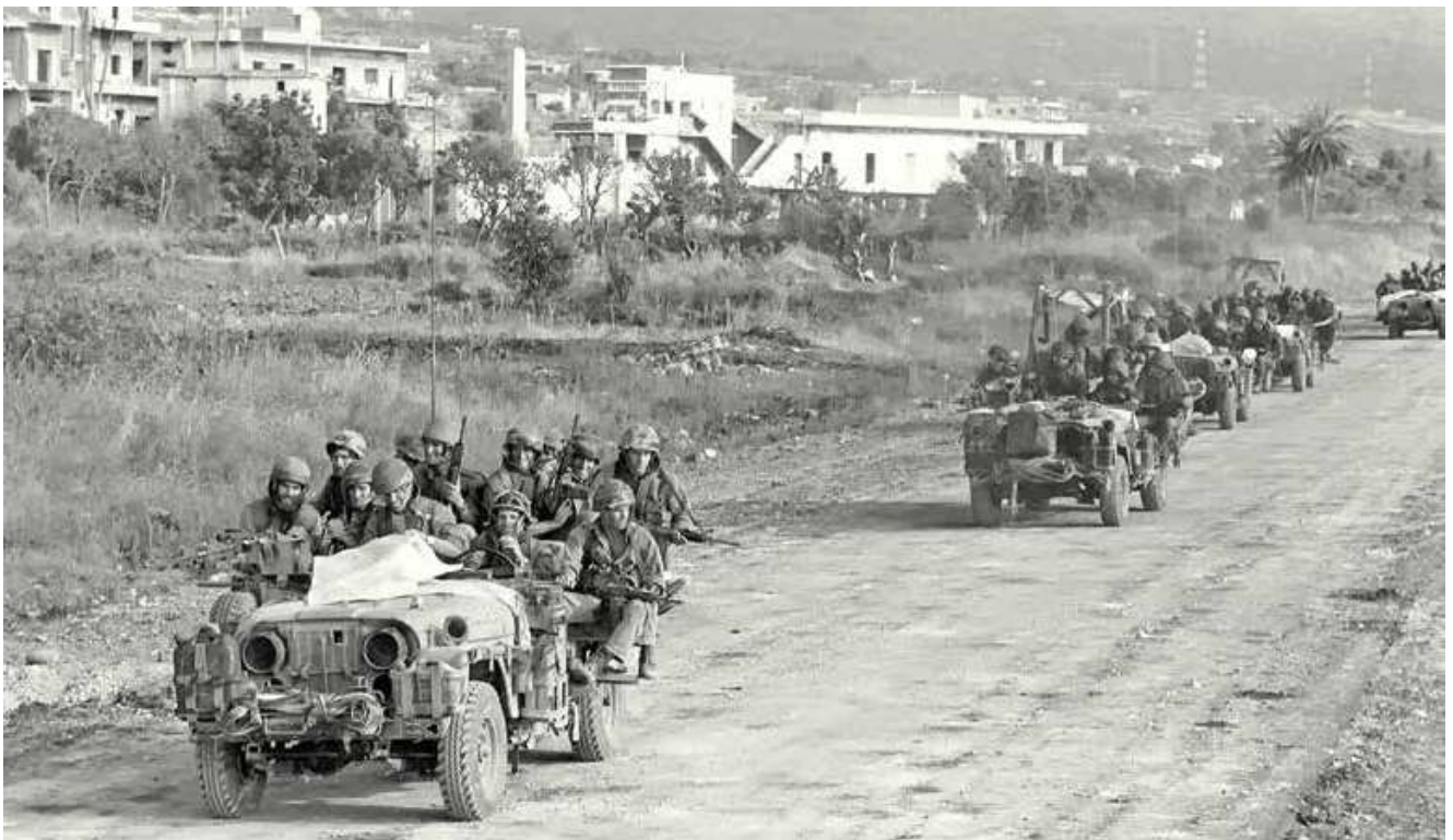
למטה: הגזרה המערבית, תנועת לוחמי גדוד 797 על גבי רכבי סיור ('ג'יפ ששת')