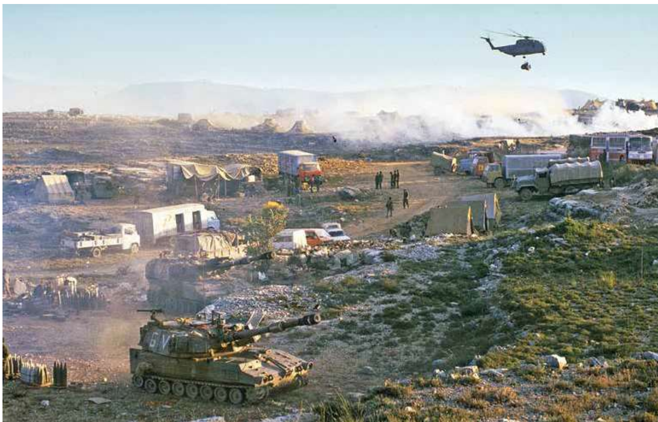
כוחות צה"ל מדרום לכביש ביירות-דמשק

בשעה 06:30, בבוקר 24 ביוני, נצפו כוחות סוריים נסוגים מבחמדון, וכך נוצרה הזדמנות להשלים את מהלך ההשתלטות על כביש ביירות-דמשק ללא חיכוך רב. בעקבות הנסיגה הסורית הנחה הרמטכ"ל לתכנן התקפה דו-אוגדתית לעבר כביש ביירות-דמשק (ציר 'מוש'), ובמהלכה תכבוש אוגדה 162 את בחמדון ותפתח את הציר עד לדהור אל-עבאדיה מערבה, ואילו אוגדה 96 באמצעות