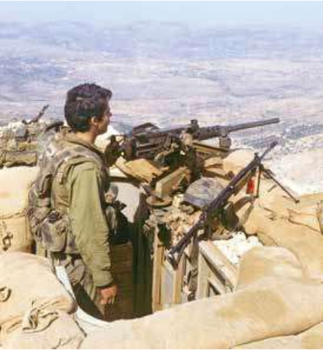
עמדת תצפית בג'בל בארוכ, הגזרה המרכזית

עיסוקו העיקרי של צה"ל לאחר תקופה זו היה המצור על ביירות. תחילתו היה עם כיתור ביירות מדרום וממזרח, שהושלם על ידי אוגדה 96 ב־13 ביוני, וסופו עם נסיגת כוחות ארגוני המחבלים והכוחות הסוריים מביירות לאחר כחודשיים. תוך כדי המצור הרחיב צה"ל את אחיזתו ממזרח ומדרום לביירות והטיל סגר ימי על חופי לבנון. בגזרה המרכזית העמיק צה"ל את אחיזתו בכביש ביירות-דמשק. לשם כך קידם את כוחות אוגדה 162 עד אזור עאליי ובחמדון, ואליהם חברו כוחות אוגדה 96, ששהו ממזרח לביירות. בגזרה המזרחית עסק צה"ל בייצוב קווי ההגנה מול הסורים תוך תיקונים קטנים בקווי העמדות. בתוך כך תפסו האוגדות 252 ו־880 שטחים שולטים ושיפרו את קווי ההגנה לקראת חידוש אפשרי של הלחימה. לצד המצור וה'זחילות' עסק צה"ל גם בפעילות ביטחון שוטף בשטחים שנכבשו. ההתקדמות המהירה של הכוחות בשבוע הראשון לא אפשרה לטהר את כל המרחבים שנתפסו ושבהם עדיין היו מחבלים רבים. כוחות צה"ל, ובעיקר אוגדות 91 ו־36, נדרשו