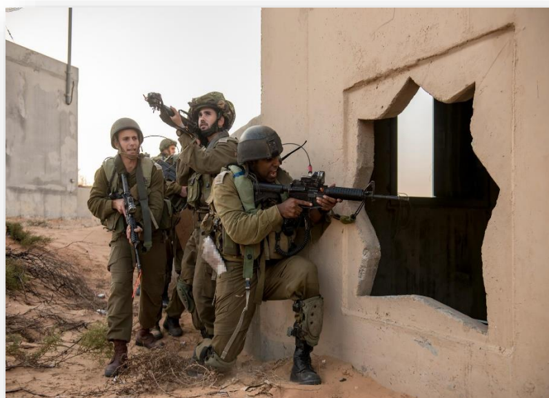
אימון במרכז הלאומי לאימונים ביבשה (בסיס צאלים)

אסונות צאלים היו אירועים טראגיים, בהם קופחו חיי אדם בשל כשלים שונים בתחום הבטיחות באימונים. האירועים העלו לדיון ציבורי את נושא תאונות האימונים בצה"ל, והחשיבות שבשמירה על נהלי הבטיחות בצבא. ולבסוף הם גם הובילו לשיפור תחום הבטיחות באימונים. כתוצאה מכך, צה"ל, בסיוע הפרקליטות הצבאית, החל לגבש המלצות בתחום הבטיחות באימונים, והביא לרביזיה של הוראות הבטיחות בצה"ל. המלצות לשיפור תחום הבטיחות באימונים אף עלו במסגרת דו"ח מבקר המדינה שפורסם ב-1999 בעקבות אסון צאלים ב'. בהמשך, הוקם ושופר מערך הבטיחות בצה"ל, בדגש על מיסודה של מערכת הדוקה להצבתם והכשרתם של קציני בטיחות ביחידות הצבא, ונכתבה הוראת הפיקוד העליון (הפי"ע) 2.0712 בדבר "בטיחות וגהות בצה"ל", המפרטת את חובת כלל היחידות הצבאיות לשאת באחריות להטמעת כללי הבטיחות. כיום,