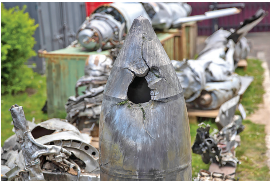
צברים של כלי תקיפה רוסיים בקייב, כולם של חימוש מנגד 3

לאחור של מערכי הקרב והימנעות מהפצצה ישירה (חימושים קצרי טווח), שעליה התבסס חיל האוויר הרוסי, תוך מעבר הדרגתי לשיגור פצצות אוויר-קרקע גולשות (STAND OFF) מאולתרות. השני - שימוש אינטנסיבי בחימושים מדויקים ארוכי טווח מנגד (STAND OFF): טילי שיוט ממגוון סוגים, טילים בליסטיים, כטב"מים מתאבדים (המונח כטב"ם המיוחס לכלי טיס איראני זה אשר נע עצמאית לכיוון אחד ללא תקשורת לאחור - עלול להטעות. זהו יותר "טיל שיוט איטי וזול". במערב הוא מכונה לרוב: one-way attack drone) שנרכשו מאיראן והורכבו ברוסיה, ואפילו טילים היפר-סוניים. קצב השיגורים נותר גבוה עד היום (MacDonald, Brinson, Brown and Sivorka, 2024), והוא ניצב על רמה של כ-600 חימושים לחודש. מדובר בעדות מובהקת ליכולת הייצור המופלאה של הרוסים (MacDonald, Brinson, Brown and Sivorka, 2024). השלישי - ניצול סד"כ הולך וגדל של משוטטים אלקטרו-אופטיים מסוג LANCET 3, שההגנה האווירית בעולם, מתקשה לטפל בהם - לצורך תקיפת מטרות נעות. והאחרון - שימוש ברחפנים חמושים (לרוב רחפנים מסחריים מהירים - הנקראים בעגה המקצועית FPV) שמקורם מסחרי, ברום הנמוך הטקטי. גם מול קטגוריה זו המענה של מערכי הגילוי וההירוט - חלקי מאוד ובעייתי למדי.