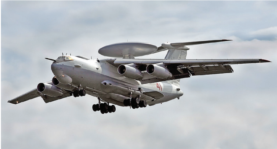
מטוס התראה רוסי A-50 מדגם שהופל על ידי אוקראינה 4

בעבור האוקראינים סיוט לוגיסטי בדמות ריבוי סוגי מערכות טק"א. גם הפער הגדול באמצעי גילוי ושליטה, שזוהה כבר בפתירת הלחימה, לא "נסגר" במהלך כשנתיים, עקב פגיעות רציפות ומתמשכות של הרוסים במכ"מים האוקראיניים.