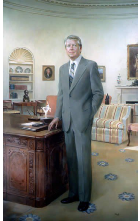
תמונה 2: ציור רשמי של הנשיא ג'ימי קרטר [5]