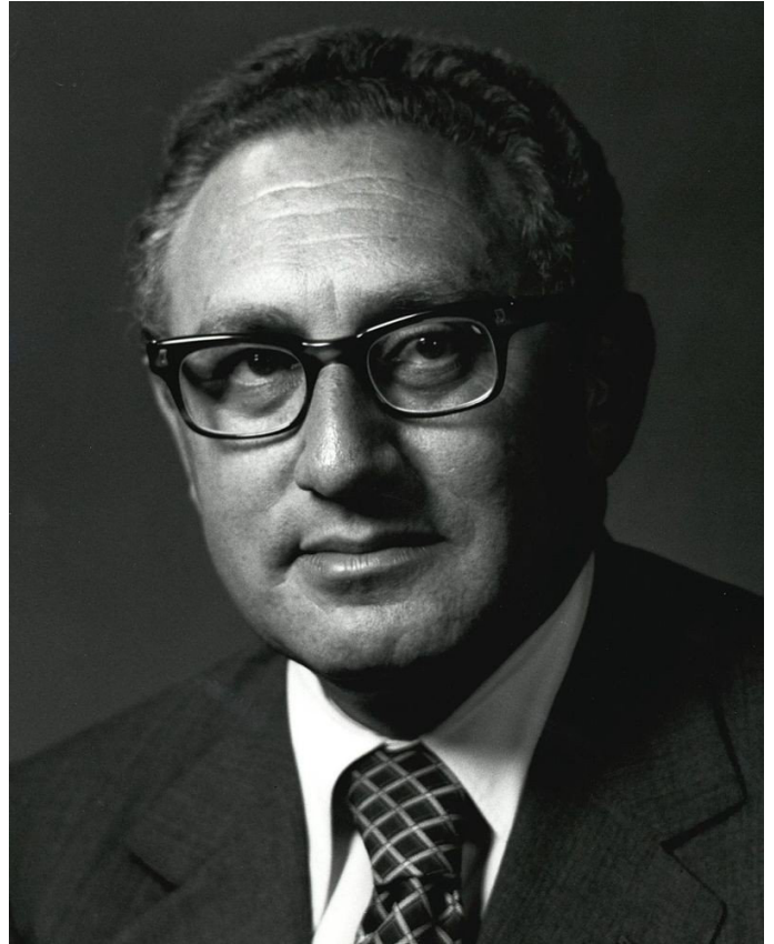
תמונה 1: הנרי קיסינג'ר, יועץ לביטחון לאומי ומזכיר המדינה של ארה"ב [4]

לחץ ישיר הופעל בשנת 1978 בעקבות מבצע ליטאני. נשיא ארה"ב ג'ימי קרטר איים להפסיק את משלוחי הנשק לישראל, אם היא לא תצא משטח לבנון. במהלך המבצע נדרשה מדינת ישראל להגביל את השימוש בפצצות מצרר רק למטרות "קשות".