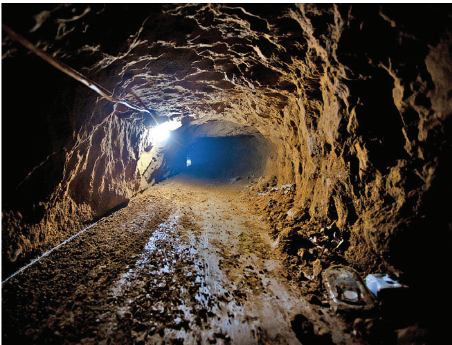
מנהרת הברחה ברפיח, 2009 49

השלישי - העדפת הסטאטוס־קו הארגוני. גם לאחר שהחליט המטכ"ל "ליטול יוזמה", התוצאה הסתכמה בחלוקת אחריות וסמכות בין הגופים השונים. "מפת הדרכים" לא הייתה חידוש תפיסתי ולא יצרה מסגרת משימתית שלא הייתה קיימת קודם לכן. המטכ"ל נמנע מפגיעה בחלוקת הסמכויות הקיימת בין הגופים השונים להתארגן מחדש, ומיעט יחסית גם בהקמה של יחידות חדשות. מנהלת ייעודית - המלצה שנשמעה שוב ושוב בגרסאות שונות - לא הוקמה. בכך למעשה מנע המטכ"ל מעצמו את האפשרות לפתח מסגרת הבנה הקושרת את תופעת המנהרות בשטח להקשר האסטרטגי הרחב יותר.