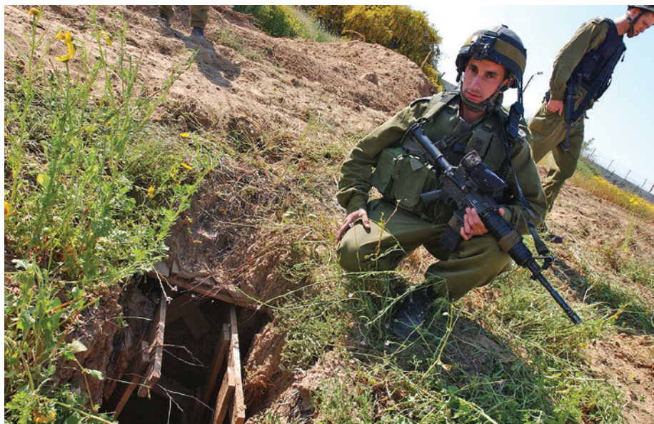
חיילי צה"ל חושפים מנהרה בציר הפילדלפי באפריל 2005

במסגרת ההתנתקות. נראה כי אי-הוודאות, שנמשכה עד לסמוך להתנתקות עצמה, והזיהוי המוחלט של המנהרות עם סוגיית הגבול ברפיח וההתעצמות של האויב הביאו את המטה הכללי לחשוב בטעות כי תחום הלחימה במנהרות עשוי להתייטר בקרוב. לעומת זאת באוגדת עזה רוח הדברים הייתה שונה. במסמך תפיסת אוגדת אזח"ע מאוגוסט 2005 עולה במפורש כי האוגדה ניתחה את איום ההתפתחות של "רשת מנהרות חוצות גדר לשטח ישראל" 37 . במקום אחר קבעה האוגדה את תפיסת המענה שלה לאיום זה. 38 למרות שהקישור בין תת-הקרקע הפלסטיני והלבנוני נעשה כבר בעבודות פנימיות, כמו בפרסומים גלויים, ולמרות שיותר מגורם אחד כבר כתב על הצורך בהתארגנות ייעודית כוללת מול התחום, לא ננקטו במטה הכללי צעדים שחרגו מתמיכה בהתמודדות הטקטית של פיקוד הדרום עם התופעה.