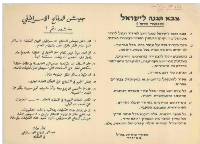
מנשר מס' 1, כפי שזה נחתם ביום 07.06.1967 ע"י מפקד כוחות צה"ל

מיד בתום נטילת השלטון באופן "פורמאלי" במנשר מס' 1, פרסם המפקד הצבאי את המנשר בדבר סדרי שלטון ומשפט (מנשר מס' 2), התשכ"ז-1967. בו, נקבעה המסגרת המשפטית שלפיה יישק דבר: "המשפט שהיה קיים באזור ביום כ"ח באייר תשכ"ז (7 יוני 1967) יעמוד בתוקפו, עד כמה שאין בו משום סתירה למנשר זה או לכל מנשר או צו, שיינתנו על ידי, ובשינויים הנובעים מכינונו של שלטון צבא הגנה לישראל באזור".