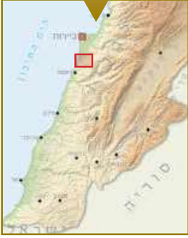
טנקי גדוד 71 מחטיבה 188 בכניסה לכפר סיל