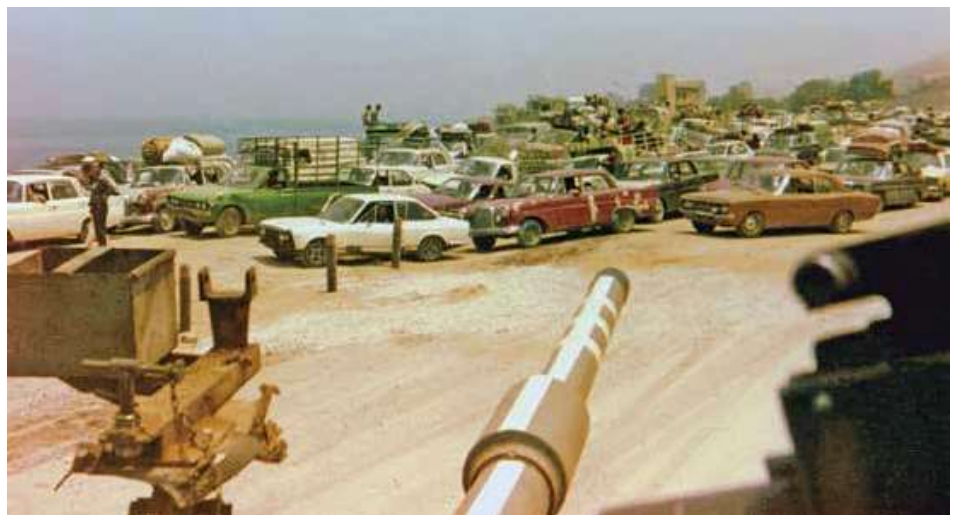
בתחתית העמוד ממול: דרום ביירות - מימין: שדה התעופה ח'אלדה; משמאל: הפבר כפר סיל

בימים 9-13 ביוני ערכו כוחות צה"ל שלושה קרבות בכפר סיל, שנועדו לפתוח את ציר התנועה לעבר ביירות. הלחימה נערכה בשטח עירוני, מול כוחות סוריים ומחבלים מבוצרים, שהיו חמושים בנשק נ"ט רב.