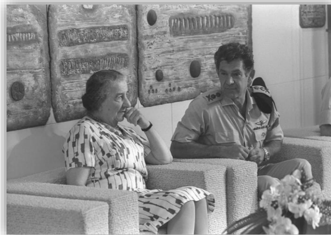
רה"מ גולדה מאיר והרמטכ"ל דוד אלעזר במהלך מלחמת יום הכיפורים

במלחמת יום הכיפורים נפלו בשבי האויב למעלה משלוש-מאות חיילי צה"ל. מידע מודיעיני וחקירת שבויים שנפלו בידי צה"ל, לימדו כי חיילי צה"ל רבים שנשבו בידי מצרים וסוריה נרצחו בעודם בשבי, בניגוד להוראות המחייבות בדין הבין-לאומי. לאחר שהפרקליטות הצבאית בחנה את החשדות, גובשו פניות ותלונות בעניין זה, ומדינת ישראל פנתה בערוצים רשמיים לארגונים בין-לאומיים שונים, ובהם האו"ם והוועד הבין-לאומי של הצלב האדום.