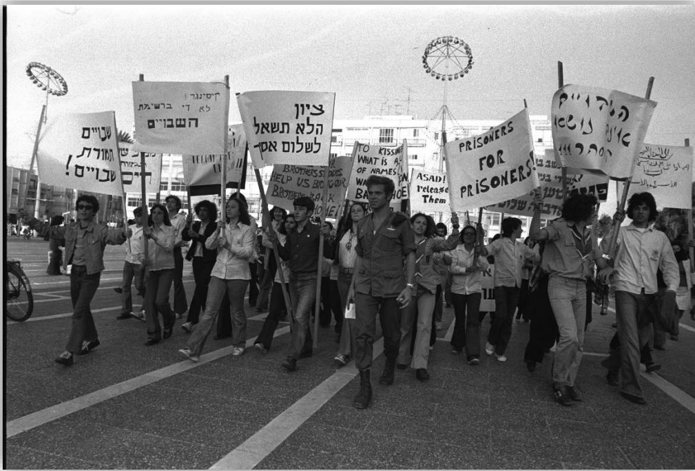
הפגנת תלמידי תיכון וסטודנטים בכיכר מלכי-ישראל בתל אביב, לשחרור שבויים מלחמה במלחמת יום הכיפורים