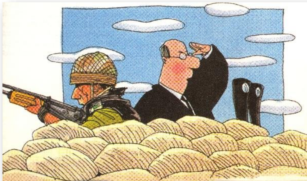
איור בדבר נוכחותם של משפטיים בקרב הלוחמים, עיתון "במחנה"

לשיטת הוועדה דאז, על היועצים המשפטיים לסגת ולהניח למפקדים למלא את משימתם. מסקנה זו של הוועדה לא התקבלה על ידי בצה"ל יש להרחיב ולמסד את מתן הייעוץ המשפטי האופרטיבי בצה"ל.