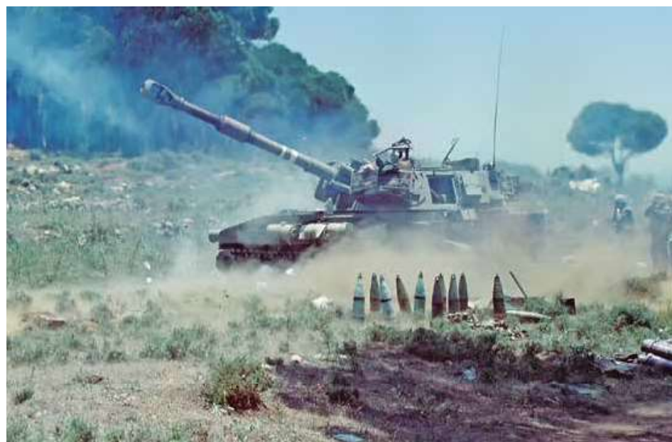
גזרת ג'בל בארוכ - צוות תותח רוכב (155 מ"מ) במהלך ירי