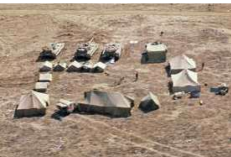
הגזרה המזרחית - מחנה ארעי של מחלקת טנקי מרכבה

חילופי האש נמשכו כשעתיים עד השעה 18:00. אבודות הכוחות הסוריים: כ-40 פצועים והרוגים, 16 טנקים, פגיעה במוצבים, בריכוזי תחמושת, בכלי רכב ובתותחי ארטילריה. ההפתעה השיגה את מטרתה, והסורים לא הצליחו להתארגן ולהגיב ביעילות והסבו רק נזק מועט לכוחות הגיס. לכוחותינו היו שני הרוגים, מ"פ וקשר מחטיבה 97, חמישה פצועים ושלושה טנקים שנפגעו מירי טנקים וטילי סאגר סוריים. בעקבות יום הקרב הגבירו הסורים את הפיקוח על פעילות המחבלים משטחם והפעילות החבלנית בגזרה המזרחית פחתה.