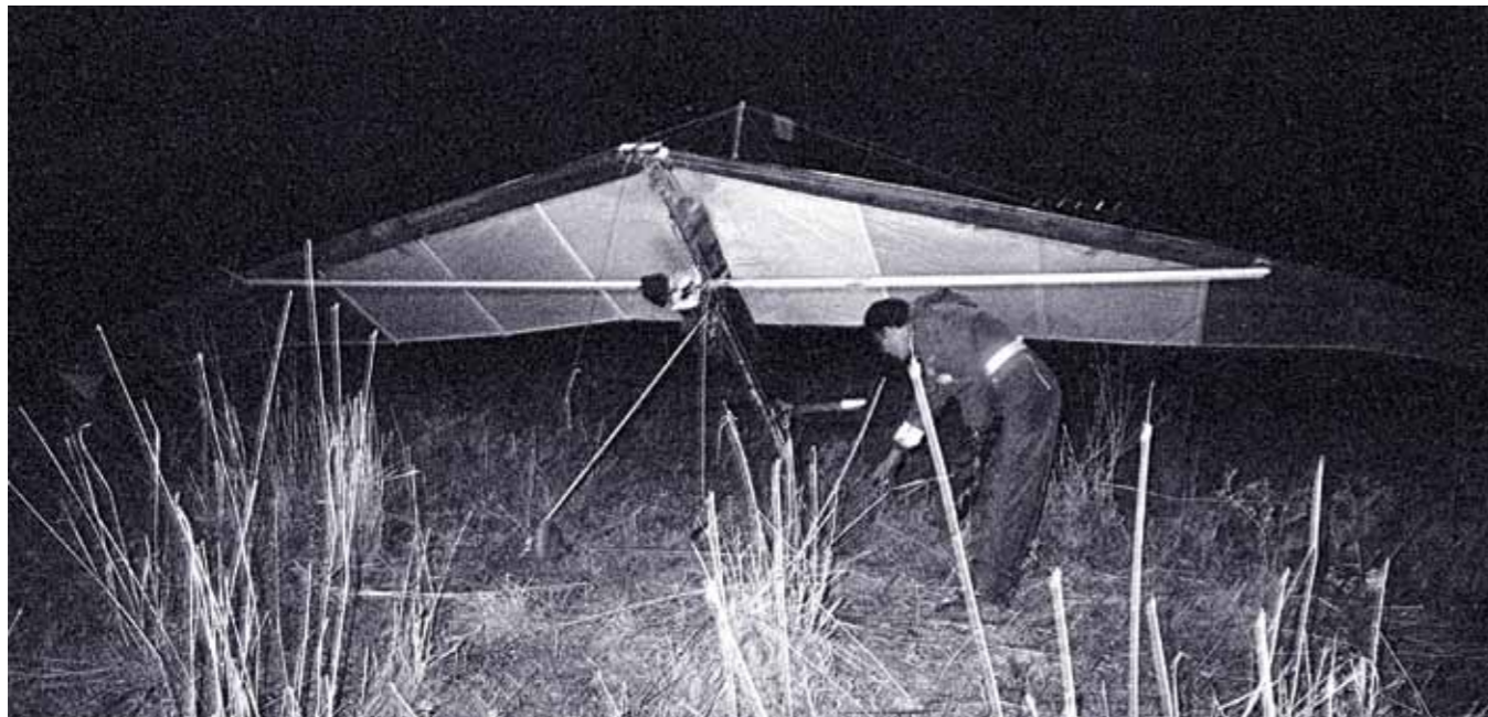
חייל בוחן את הגלשון, 1987

כשהותקף או בפחד שאחז בו, שכן אלה תופעות טבעיות שהן נחלתו של כל חייל שנקלע למצב דומה. החרפה נעוצה בכך שבהיותו בתפקיד זקיף בשער המחנה, נשקו בידו ומחסניות טעונות בחגורו, לא ניסה כלל להתמודד עם המצב שאליה נקלע: לטעון את נשקו, ליישם את תרגולת הקרב שאותה למד, או לנסות להזעיק את חבריו או מפקדיו כדי שיבואו לעזרתו. למרות חששו מן הסכנה שבפניה ניצב, חובתו הייתה לפעול. בנוסו על נפשו הפקיר את משמרתו ואפשר למחבל להיכנס באין מפריע לתחומי המחנה ולרצוח חמישה חיילים - חבריו. בפסק הדין נקבע כי השירות הצבאי כרוך מעצם טיבו ומהותו בסיכונים שונים, ואך טבעי הוא שחייל יחשוש ויפחד מפני סיכונים אלה. אולם אין בחשש זה כדי להצדיק את אי-מילוי של המשימות שהוטלו עליו כל עוד אפשר לבצען, אפילו אם יהא עליו להקריב את חייו; כך עולה משבועת האמונים של כל חייל לצה"ל. מלוחם מצופה להתגבר על פחדיו ולהילחם כנדרש ממנו. משכך, נדחה ערעורו של טור' אלמוג על הכרעת הדין. בית הדין חתם את דבריו באמירה על המצופה מחיילי צה"ל: