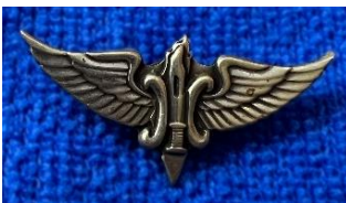
סיכת סיירת שקד

במרוצת 1966 נעתר אכ"א לדרישה ולנוהג שהיה מקובל ביחידות שונות בצבא, והוא פעל להכשיר ולהסדיר ענידה של סיכות יחידה ושל סיכות לבעלי תפקידים (יסמלי יחידה קטנים) על ידי יצירת מנגנון קבוע לאישור ביטחוני וגרפי של בקשות לסמלים. שינוי מדיניות זה הוביל לשטף של בקשות לאישור סמלי יחידה. בין הסמלים הראשונים שדן אכ"א היה סמל סיירת שקד . בהנחה שהסמל שאושר בוועדת הסמלים במרץ 1967 זהה לסמל המוכר כיום – סכין קומנדו ניצבת על רקע שושן ומפת הארץ, ומצדדיה זוג כנפיים – זו סיכת היחידה הרשמית הראשונה שכללה את פרח השושן . 36