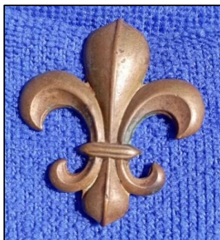
סמל רגימנט מנצ'סטר