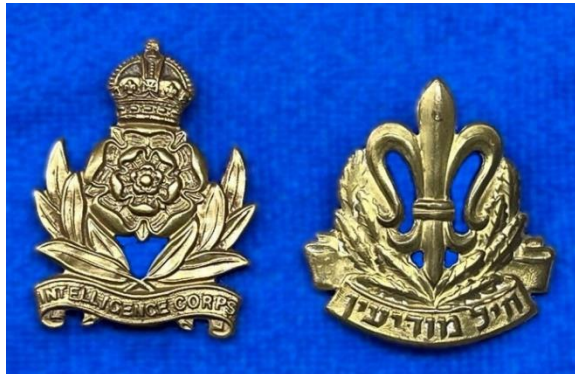
סמלי המודיעין בצה"ל ובצבא הבריטי

בד בבד אפשר שהיכרות עם צורתו הכללית של סמל המודיעין הצבאי הבריטי, Intelligence Corps, אכן נתנה השראה למעצב סמל חיל המודיעין . בריאיון ל'במחנה' ציין בלאושילד מפורשות כי את הרעיון לסרט שעליו כתוב שם החיל נטל מהסמלים הבריטיים.