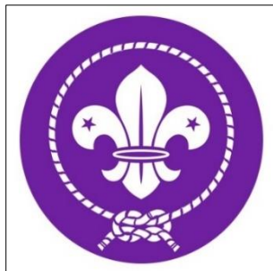
סמל תנועת הצופים העולמית

מנגד, אפשר כי בלאושילד, בוגר תנועת הנוער הצופית-חלוצית 'הנוער הציוני – הרצלייה', 23 או אדם אחר בחרו לשבץ את פרח השושן בסמל חיל המודיעין מתוך הזדהות עם משמעות סמל תנועת הצופים, כפי שמייסד התנועה, רוברט באדן פאוול, פירש אותו (בהנחה שאכן היה מודע הוגה סמל חיל המודיעין לפירוש זה). לפי באדן-פאוול, כאות הוקרה למלך שארל הראשון שמוצאו מצרפת, במאה ה-13 השתמש הימאי פלאביו ג'יאווה בפרח השושן (בשילוב האות הלטינית T) כסימן לציון הצפון בדגם של מצפן שאותו פיתח; מאז באופן מסורתי במצפנים ובמפות סמל זה מצביע על הצפון. "המשמעות שלמעשה יש להסיק מסמל ה־Fleur de Lys", הסביר באדן-פאוול, "היא שהוא מצביע תמיד על הכיוון הנכון (ולמעלה), לא פונה ימינה ולא שמאלה, מפני שכיוונים אלו מובילים שוב לאחור". 24 בהשאלה ממשמעות זו אפשר כי הוגה סמל חיל המודיעין ביקש לומר שהמודיעין מורה על כיוון הפעולה הנכון לכוחותינו.