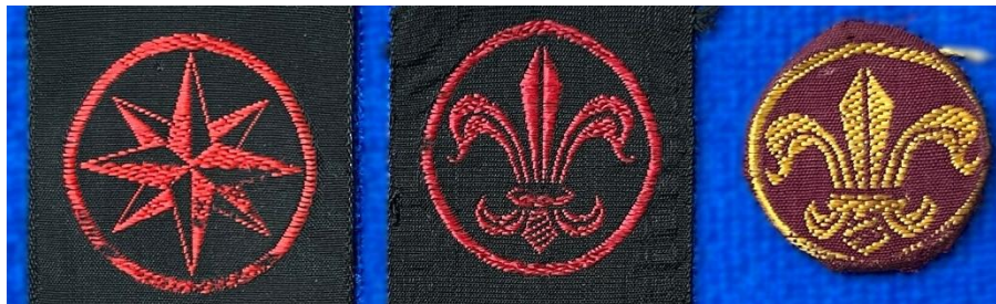
סימני מקצוע: הימני - סייר (ומש"ק סיירים), השניים האחרים - מודיעין

מאז אותו תג כובע ועד ימינו התקבע פרח השושן כסמלו המובהק של המודיעין, והוא בא לידי ביטוי בשלל סימני היכר שהתפתחו בהדרגה ונועדו לייחד את איש המודיעין מסביבתו (תהליך ההבחנה וההיבדלות באמצעות סימנים מסימנים שונים לא היה כשלעצמו ייחודי לחיל המודיעין). הפעם השנייה שבה השתמשו בשושן בסמל רשמי הייתה בתחום סימני המקצוע. במרץ 1954 נקבע כי שושן צהוב על רקע אדום ישמש סימן המקצוע של סייר (ובהמשך גם של מש"ק סיירים). באוקטובר 1956 הוגדר שסימן המקצוע של מודיעין יבוטא בסמל של שושן אדום על רקע שחור, 34 ושסימן המקצוע של סיור ממונע יהיה טנק ושושן אדומים על רקע שחור. ביוני 1970 נקבע סימן מקצוע נוסף לציון מקצועות מודיעיניים אחרים, בדמות שושנת רוחות אדומה על רקע שחור. 35