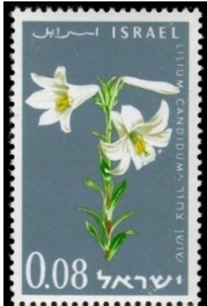
השושן הצחור בבול ישראלי (עיצוב: צבי נרקיס)

אחרית דבר: פרח השושן מתקבע כסמלו המובהק של המודיעין בשנתיים הראשונות לקיומו של צה"ל לא היה כל סממן חיצוני רשמי שהצביע על שיוכו של חייל לחיל המודיעין או לתחום העיסוק המודיעיני. איש מודיעין שהשתייך לחטיבה כלשהי נתבקש לענוד את תג כובע צה"ל ואת סמל השרוול של אותה חטיבה. 33 תג הכובע של חיל המודיעין כפי שאושר ב־1950 היה לסימן הזיהוי הראשון שהבחין ביו אנשי מודיעין לחיילים מחילות אחרים.