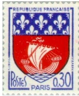
סמל עיריית פריז ובו פרח השושן, סמל בית בורבון, בבול צרפתי (עיצוב: אנדרה בר ורובר לואי)