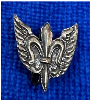
סיכת להק מודיעין