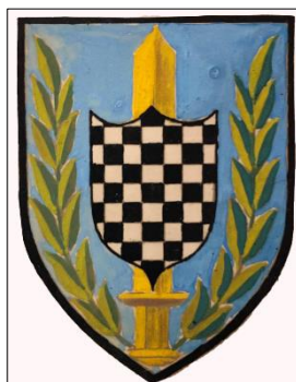
הצעה לסמל בסיס שירות מודיעין (א"צ 59/1551/1951)

נראה כי ברקע להחלטה עמדו שני אירועים : האחד, ארגונו של המודיעין כמחלקה באגף המטה הכללי (אג"ס־ממ"ן) והפיכתו למטה המקצועי של מערך המודיעין הצבאי, חיסול מטה שירות המודיעין הצבאי והקמתו של 'בסיס שירות מודיעין' כמסגרת מנהלית לכל יחידות המודיעין (מרץ–מאי 1949). 7 השני, הנחיית אכ"א לחטיבות, לחילות ולשירותים להכין עד 19 במאי 1949 הצעות לדגל יחידה , שאותו יקבלו ביום הצבא שייקבע בהמשך. 8