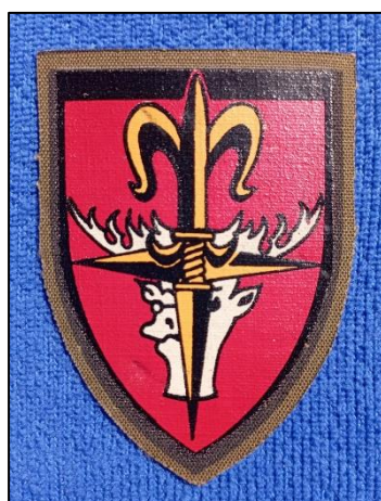
סמל שרוול יחידת אגוז

בהמשך לסיירת שקד הגישו יחידות שונות בקשות לסמלים שבהם על פניו שימש מרכיב השושן ביטוי למודיעין ולסיוור. לראשונה ביולי 1970 אושרה סיכה שנועדה להיענד בידי חיילי המודיעין , 37 ובהמשך אושרו סיכות ליחידות ולמקצועות מודיעיניים ספציפיים, כגון סיכה לבוגרי קורס אלחוטנים ביחידה 8200, סיכת מפענח, סיכת להק מודיעין (למד"ן) וסיכה ליחידת המודיעין של פיקוד הדרום. בשנים 1966–1994 אושרו לפחות 13 סיכות שבוודאות כללו את סמל השושן ו-18 סיכות נוספות שבהן, ככל הנראה, נכלל הסמל . מתוך סיכות אלו, 21 השתייכו לחיל המודיעין , חמש – לחיל האוויר, ארבע – לסיירות (כולל סיירת ימית), ואחת השתייכה למפקדת חילות השדה. 38