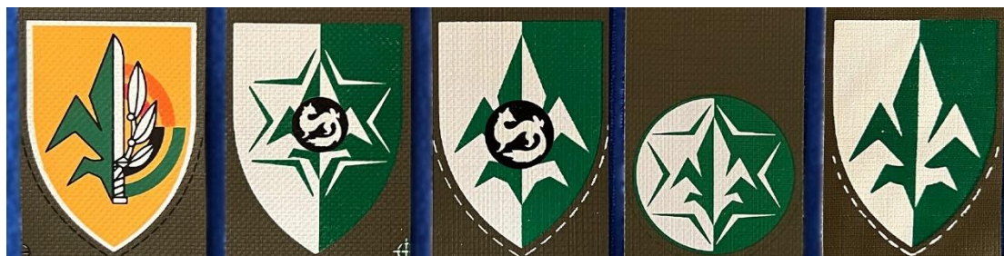
סמלי שרוול: חיל המודיעין (גרסת בד שמשונית של הסמלים שאושרו ב-1977 וב-2002), מודיעין פיקוד הדרום (1990 ו-2008) ומפקדת קצין מודיעין השדה הראשי (2000)

במהלך השנים נוספו תגים נוספים הנושאים את סמל השושן, ובהם תגי יחידות המודיעין בפקודים המרחביים (אפריל 1990), תג מפקדת קצין המודיעין השדה הראשי (מאי 2000) ועוד. במרץ 2002 עבר התג החילי