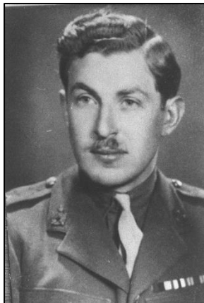
חיים הרצוג, לימים ראש ממשלה, קצין מודיעין בריטי. על דשי מדיו סמלי ה־ Intelligence Corps