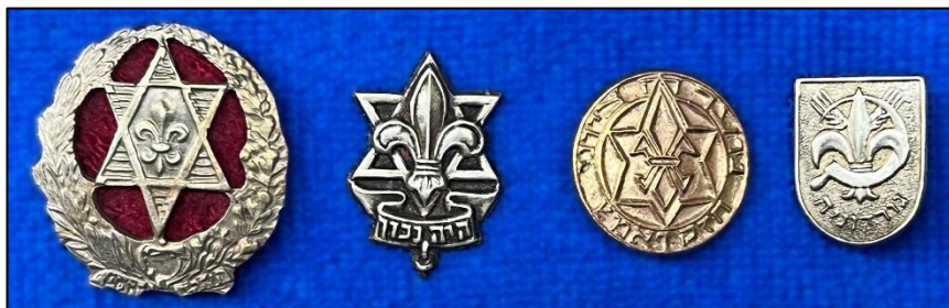
מימין: סיכות תנועות נוער ועליהן סמל השושן: גורדוניה, הנוער הציוני, הצופים והשומר הצעיר. משמאל: חותמת מתקופת המנדט הבריטי ועליה סמל גוש הצופים הקשישים בתל אביב (ארכיון יד טבנקין 3/307/3-11)

נקבע סמל ראשוני של תנועת 'השומר הצעיר', שושן וזר עלי דפנה מוקפים במגן־דוד. בוועידת היסוד של הסתדרות הצופים העבריים בארץ ישראל ב־1936 אומץ סמל חדש לתנועה בדמות שושן מונח על גבי מגן־דוד ומתחת להם הסיסמה 'היה נכון'. 'גוש הצופים הקשישים' שבתל אביב כבר אימץ את השושן לסמלו עם הקמתו ב־1928. 29