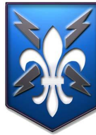
סמל השרוול של חטיבה 205 (מודיעין צבאי) של צבא ארה"ב