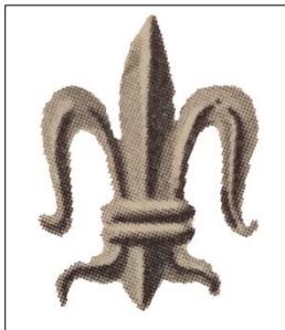
ציור ראשוני של סמל חיל המודיעין

חודש מאוחר יותר, ייתכן בהמשך לשיחה עם הרמטכ"ל הנכנס, רב-אלוף יגאל ידן, סיכמה הוועדה להכין הצעה לתגי כובע נפרדים לכל חיל, אשר ייענדו על גבי רקע צבעוני. רקע מצבע זהה ייענד גם מתחת לסימני הדרגה. הרקע שנבחר לייצג את המודיעין, כמו את חיל הקשר ואת חיל ההנדסה, היה ירוק. ההחלטה לקבוע תגי כובע חיליים עוגנה בישיבת המטה הכללי ב-26 בדצמבר. מנגד, החליט המטה הכללי שרקע תגי הכובע יהיה זהה עבור כל חילות היבשה, וצבעו אדום. 15