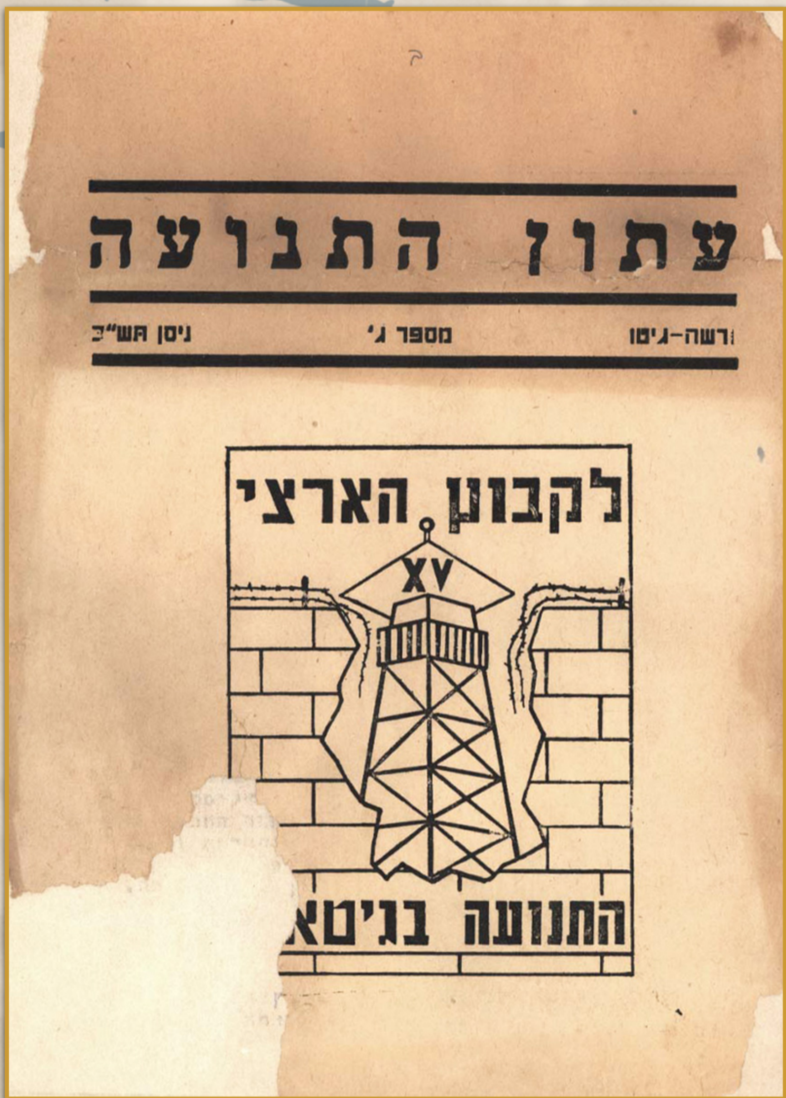
עיתון מחתרת שיצא לאור בגטו ורשה.