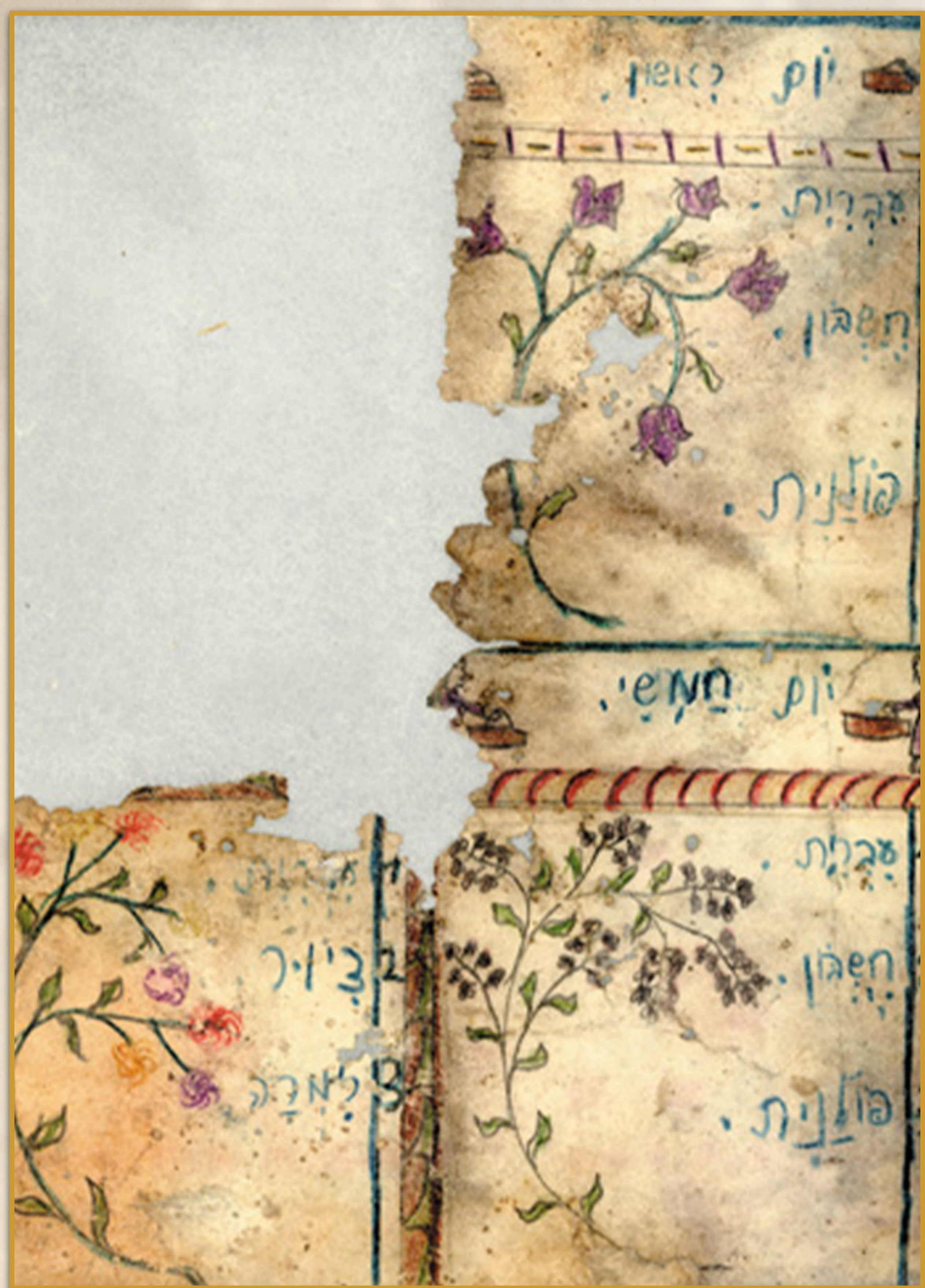
מערכת שעות לתלמידי בית ספר. שפת ההוראה היא עברית.

יחסוריו העגזי יצאך להקדים כל הואם לאישה היהודייה במאחמה. היא גרפוס כל חשוד בהיסאוריה היהודיג עם אומץ לכה וכוסר עמיזגה. בזכוגה עם ביזי אפיו משפחוג להגגבר עם אימג הימים. בזמן האחרון ניכרג גופעה מעניינג. בחתך מוועדי הזגים גופסוג נשים אג מקום הגזרים המגפארים מגפארים עייפים וסחאים מעזוגגים עם עגה. יש ועדי בגים שההנהלה כולה מורכג מנשים בלבדי!"