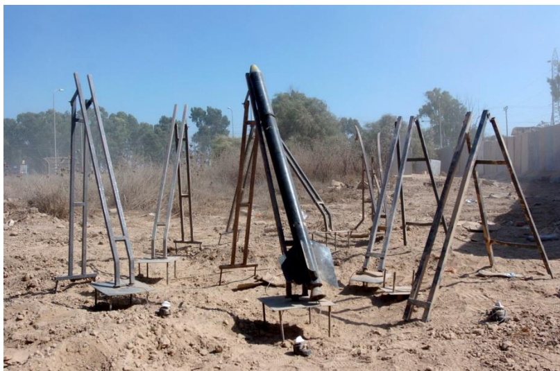
תמונה מס' 2: משגרי רקטות 'קסאם'

יכולות רקטיות לא מבוטלות קיימות גם ברצועת עזה, בידי ארגוני החמאס והגא"פ. מקורן בשנות האינתיפאדה השנייה ובמעבר מנשק המתאבדים לנשק הרקטות. הקושי להמשיך ולבצע פיגועי התאבדות בתוך שטח ישראל הוביל גורמים בחמאס ובגא"פ לפתח זרוע רקטית עצמאית. "טפטוף" הקסאמים שהחל מרצועת עזה בתחילת שנות ה-2000 הפך לזרוע אווירית של ממש, בייצור עצמי ובעזרה איראנית, שבאמצעותה הצליחו תחילה לשבש את חיי התושבים באזור עוטף עזה ובהמשך לאיים כמעט על כל שטח ישראל. ירי הרקטות מרצועת עזה הוביל עד היום לשלושה מבצעים צבאיים: "עופרת יצוקה" (2008), "עמוד ענן" (2012) ו"צוק איתן" (2014), כשביניהם סבבי לחימה רבים.