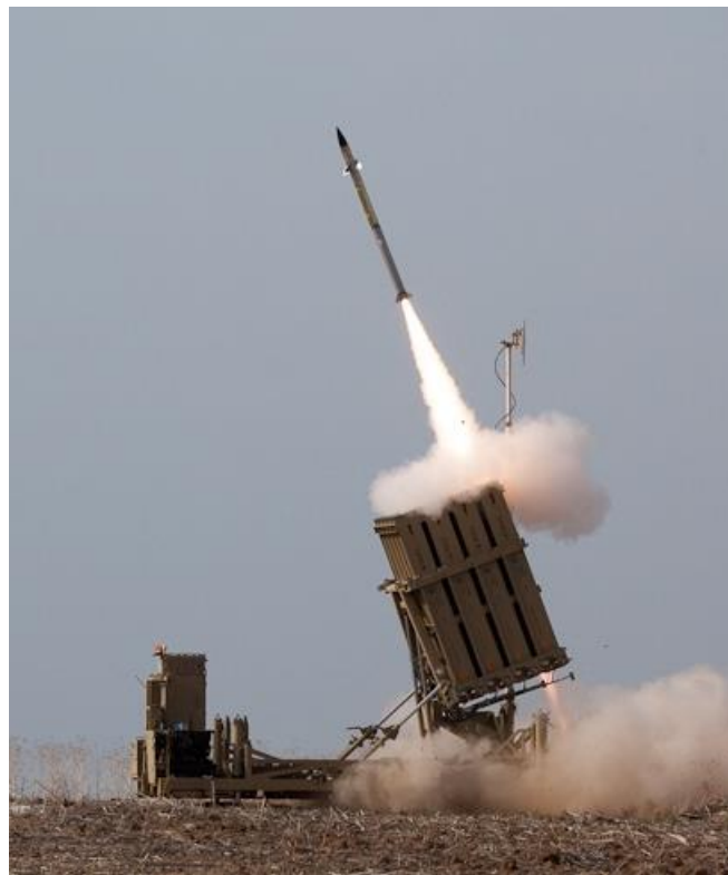
תמונה מס' 1: משגר "כיפת ברזל" 5

מלחמת לבנון השנייה (2006) והחרפת ירי הרקטות לאחר ההתנתקות מרצועת עזה, הביאו את הממסד הביטחוני בישראל, ובראשו את שר הביטחון דאז עמיר פרץ, לקדם את פיתוח מערכת "כיפת ברזל", כחלק מתפיסה להגנת העורף הישראלי מפני ירי רקטות קצרות טווח. כיום, המערך כולל גם את מערכת "שרביט קסמים" להתמודדות עם איום הטילים לטווח בינוני (עדיין לא בשימוש) ואת מערכת "החץ", שמיועדת להתמודד עם איום הטילים ארוכי הטווח והלא קונבנציונאליים.