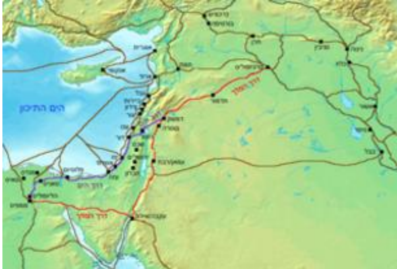
דרך הים (סגול), דרך המלך (אדום), ודרכי מסחר עתיקות נוספות. 1300 לפנה"ס לערך, (מקור: ויקיפדיה).

השינויים הטקטוניים בזירה החברתית כלכלית, הביטחונית והעולמית יחייבו את ישראל לשנות מרכיבים בתפיסת הביטחון הלאומי שלה ואת האסטרטגיה הביטחונית והמדינית בהתאמה. כמו מדינות רבות בעולם המערבי, ישראל צפויה לנטוש את אסטרטגיית ההכלה כהגיון המוביל ולאמץ גישה פרו-אקטיבית, תחרותית, במסגרתה היא פועלת לעצב את הכלכלה, החברה והביטחון, תוך השתתפות אקטיבית בעיצוב מרחבי של הסביבה המזרח תיכונית.