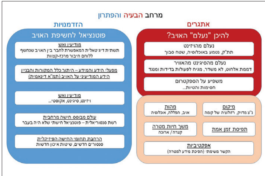
איור 5: מרחב הבעיה והפתרון

זה תאפשר את הקדמת האויב, בהבנה של המתרחש בכמה זירות לחימה במקביל ובסיכול האיומים העתידיים להתרחש. ג. הקמת מפעל מידע וידע כלל אמ"ני. ריכוז מאמץ ארגוני סביב המערכות והאפליקציות בשימוש, הארכיטקטורה הדיגיטלית, חיבור והגנת הרשתות, אחסון המידע והקשרים בין אמ"ן והתעשייה האזרחית.