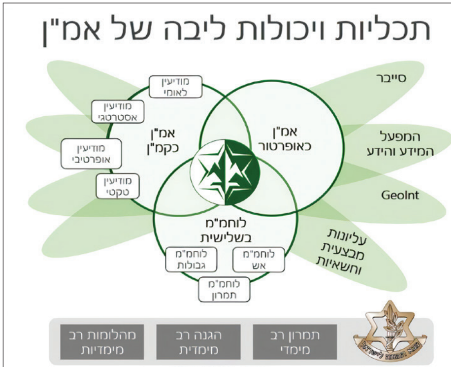
איור 3: תכליות אמ"ן

שאותן ממלא אמ"ן מתוקף תפקידו: אמ"ן כמתאר את המציאות, אמ"ן כאופרטור (מוציא לפועל משימות הפעלת הכוח) ו אמ"ן כמכפיל כוח בשדה הקרב . בפרט בעידן המב"ם עלה השיח סביב תפקידו של אמ"ן כזרוע פעולה שתשמש למהלומה תוך שימוש ביכולות ובכלים העומדים לרשותה, כגון סייבר, קומנדו, תודעה, השפעה, שיבוש והונאה, שיש בהם כדי לשנות את פני המערכה למול האויב.