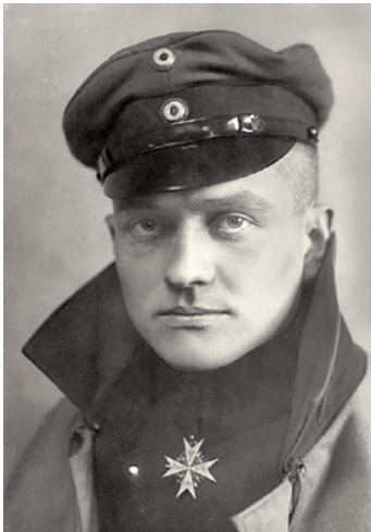
מנפרד פון ריכטמן, "הברון האדום". 2

המאבק המשמעותי הראשון על עליונות אווירית התנהל במלחמת העולם הראשונה. הצבאות הלוחמים הפעילו מטוסים לתועלתם ובמקביל ניסו לפגוע במטוסי האויב באמצעות ירי מהקרקע, בניסיון ליצור מכשול אווירי (בלונים ורשתות), בניסיון להפלת מטוסים בקרבות אוויר ופגיעה בהם בעודם על הקרקע. במלחמת העולם הראשונה השתכללו לוחמת האוויר ואופן קיום קרבות האוויר עד לדרגת אומנות, במטרה להשיג עליונות אווירית. מרבית העקרונות לקרבות אוויר שנוסחו בידי המצטיינים, כגון "הברון האדום" פון ריכטמן הגרמני (80 הפלות), ורבים אחרים, תקפים עד היום.