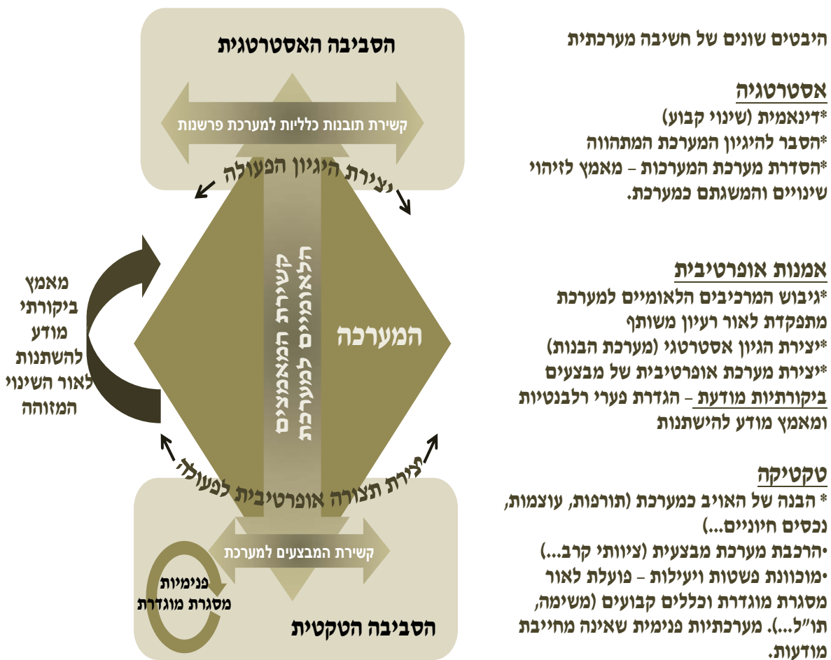
איור 1 – גישה מערכתית וגילומה בסביבות התפקוד השונות

7. לסיכום עניין זה, האמנות האופרטיבית נדרשת לחשיבה מערכתית ביקורתית . חשיבה שעוסקת בגבולות המערכת העצמית שלנו, מגדירה אותה מחדש ומכתיבה השתנות. העיסוק האופרטיבי מחייב, לכן, רמות מודעות נוספות על אלו המאפיינות סביבות אחרות. נוסף על המודעות הראשונה – המודעות לנסיבות ולתוכן (למשל האויב והקרקע, או המטרות של הדרג המדיני), נדרשת מודעות נוספת – המודעות למסגרת התפיסתית שבתוכה אנו מנהלים את החשיבה. ללא מודעות למסגרת התפיסתית ("הפרדיגמה") המוסדית, לא ניתן יהיה לקיים חשיבה ביקורתית על מידת התאמתה לנסיבות שהשתנו ועל הצורך ביצירת מסגרת תפיסתית אלטרנטיבית. בהמשך הדיון נלמד שהאמנות האופרטיבית דורשת רמת מודעות שלישית – מודעות תהליכית לנושא הלמידה, רמת ה"חשיבה על החשיבה".