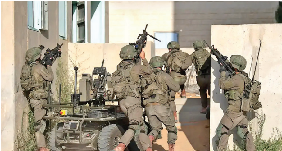
היחידה הרב-ממדית בתרגיל בצאלים

והינה, בוקר אסטרטגי אחד, מתבהרת אצלנו ההבנה כי הבעיה היא איראן; לא רק הגרעין האיראני, אלא איראן עצמה. בסיסי הטילים המכוונים לישראל, מפעלי התעשייה הצבאיים שם, מערכת ההגנה האווירית המורכבת - כל אלה הם יעדים לפיצוח הכרחי. ולא רק זאת; איראן מפתחת את יכולותיה בעיראק, בתימן, בסוריה ובים האדום - על כל אלה נדרשת להשגיה מקרוב ולפעול כשצריך - תל-אביב. התמודדות זאת, שאינה לפי מידותיה הטבעיות של ישראל, מחייבת שותפים באזור (אורטל, 2022, עמ' 39). ועל מי מוטלת מלאכת הניצוח על היחסים החדשים ופיתוח ארכיטקטורת ההגנה וההגנ"א האזורית? על תל-אביב.