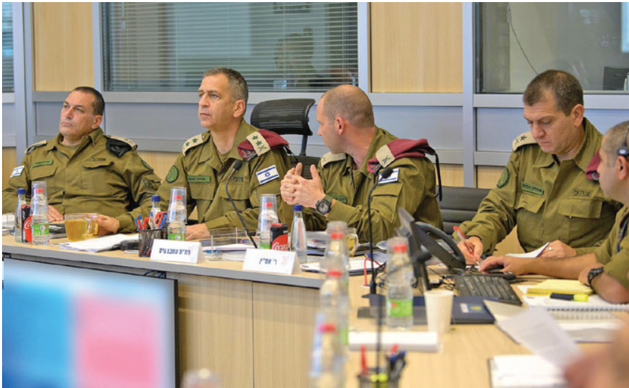
הרמטכ"ל כוכבי והמטה הכללי בהערכת מצב במהלך מבצע "שומר חומות"

הצבאי של האויב ה"אסימטרי" אינה נדרשת עוד כיעד מלחמה. ואכן מוסכם על רוב הפיקוד הבכיר כי גם בהינתן תגבור משמעותי נוסף של מטרות, חימוש ומיירטים – גם אז לא תיתכן הכרעה אופרטיבית והסרה של איום האויב בכוח, אלא הדבר מאפשר רק סיכויים טובים יותר לאכיפה פוליטית (ולכן גם זמנית) של רצוננו על האויב.