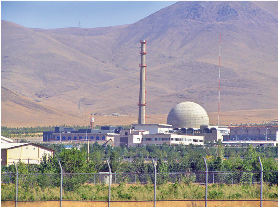
כור גרעיני "IR-40" שנמצא בסמוך לעיר אראכ שבאיראן 16