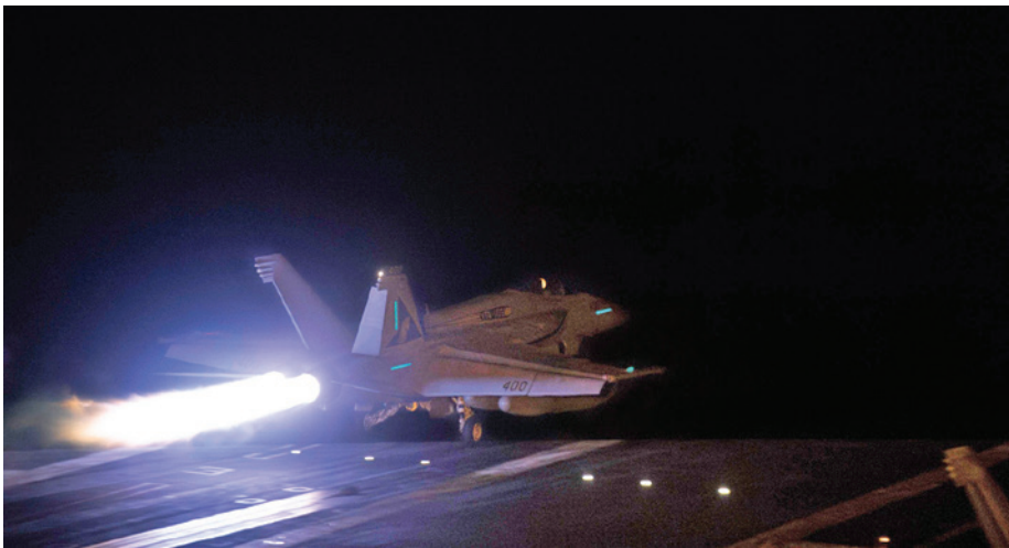
מטוס קרב מסוג F-18 ממריא מנושאת המטוסים אייזנהאואר לתקוף יעדים של ארגון החות'ים בתימן בינואר 2024

זהו סממן למעבר למדיניות א-ליברלית, כלומר קבלה של מנהיגים של מדינות א-ליברליות כפרטנרים משמעותיים של ארה"ב. מעבר להשפעתה של השקפת העולם הא-ליברליות של ממשל טראמפ, ייתכן כי גורמים מערכתיים בין-לאומיים משחקים כאן תפקיד - במיוחד בהתחשב בכך שההגמוניה האמריקאית כבר לא בשיאה, ויכולתה של ארה"ב לעצב את העולם בדמותה שלה נתונה יותר ויותר בספק. הדבר אינו אומר, כמובן, תמיכה בכל משטר אוטוריטרי, אלא עיצוב המדיניות לפי האינטרסים החומריים של ארה"ב מול משטרים כאלה. כך יזם טראמפ מלחמת סחר עם סין ונקט בקו תקיף נגד איראן. מצד שני, הישג מרכזי בכהונתו הראשונה היה הסכמי אברהם, שאותם תיווך בין ישראל לבין איחוד האמירויות הערביות ובחריין ב-2020. ממשל טראמפ אף ניסה להגיע להסכם גרעיני ישירות עם הרוזן הצפון קוריאני. הניסיון אמנם קרס, אך ראוי לציין שנעשה ניסיון כזה עם מנהיג מסוג זה מלכתחילה. כן היה נראה שמתחוללת התקרבות מסוימת בין טראמפ לפוטין, אם כי לא נרשמה התקדמות מרחיקת לכת ביחסי רוסיה-ארה"ב בקדנציה הראשונה.