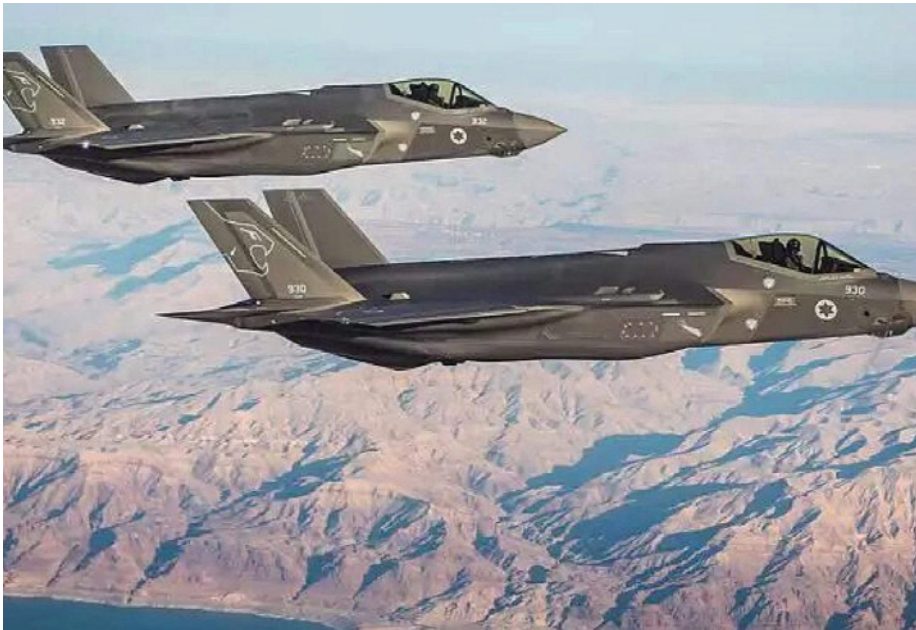
מטוסי קרב מסוג F-35 (אדיר) של חיל האוויר הישראלי