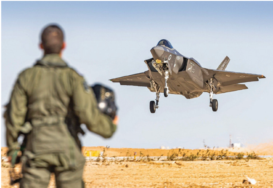
מטוס "אדיר" של חיל האוויר

האזורית לתקיפה, במיוחד של בעלות בריתה של איראן. 6 אפשר להסיק, כי בשקלול שיקולים אלה ואחרים, הצביע מאזן עלות מול תועלת מערכת נגד ביצוע התקיפה.