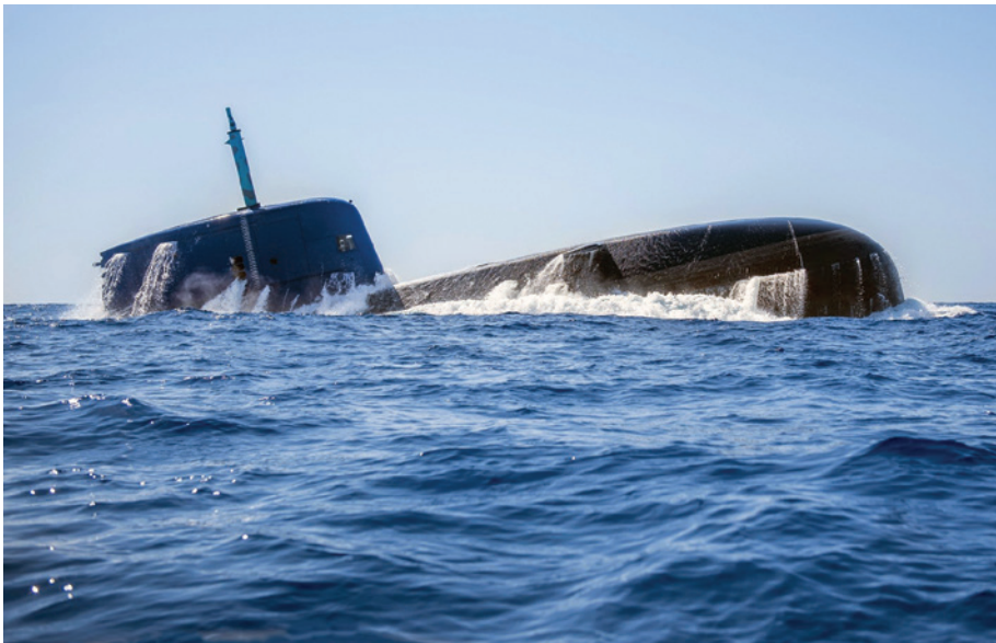
צוללת של חיל הים הישראלי עולה מהמעמקים

רואים בה לכל היותר מדינה קטנה, חזקה ומשפיעה, אך לא מעצמה אזורית. לדידם, אומנם מצבה של ישראל טוב לאין שיעור ממצבה בדורות קודמים, אולם מצבה הדמוגרפי מורכב ומאתגר, ולפיכך יש להתייחס לישראל כאל שחקן חזק ומשמעותי אך לא כאל מעצמה אזורית.