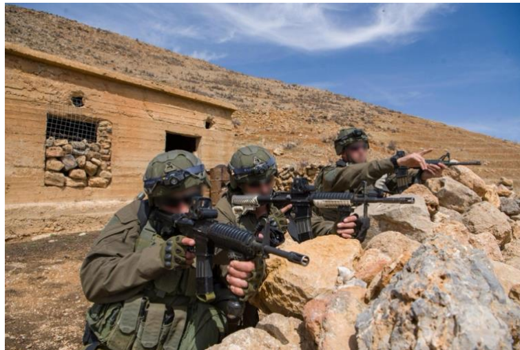
כוחות אוגדה 210, בהם יחידת האלפניסטים ויהל"ם, במוצבי צבא סוריה בכתר החרמון.

כך או כך, המשמעות המיידית בעבור צה"ל הינה שלא ניתן עוד להדחיק את העיסוק בתורכיה ויש לבחון שילוב של העיסוק בה כמרכיב באסטרטגיה הצבאית שלנו בשנים הקרובות. עיסוק בתורכיה במסגרת אסטרטגית צה"ל אין משמעותו מיצובה כאיום צבאי מידי, אלא מבטא את ההכרה כי כל אסטרטגיה צבאית אזורית חייבת להכיר במאזן הכוחות החדש שנוצר בעקבות המלחמה, במסגרתו ניצבת תורכיה, כמעצמה אזורית, שמהווה חלק מרכזי יותר מבעבר באזור.