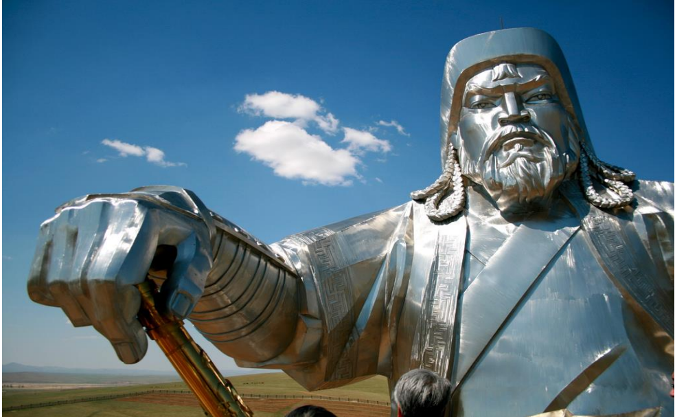
תמונה 1: פסל מתכת של ג'ינג'ס חאן במונגוליה. כשהיה מגיע לעיר הגדולה, היו כוחות האויב בורחים

מפני הסיפורים ששמעו על מסעותיו. (מתוך: ויקיפדיה) 25