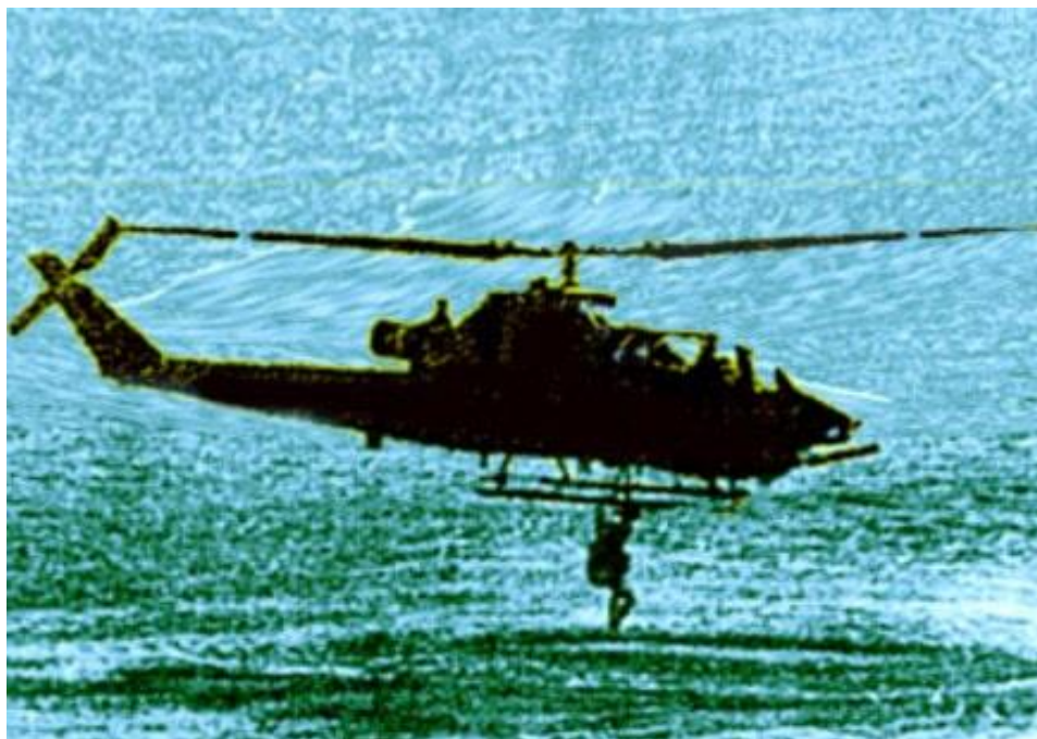
איור 3: החילוץ המוסק במבצע "כחול וחום", שהתבצע תחת אש. נקטו בו בדפוס פעולה של תמונה 3: "נבחרת" במקום פעולה של יחידה אחת. 15