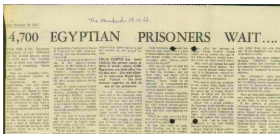
כותרתה של כתבה בעיתון "The Standard" מ-19 באוקטובר 1967, המסקרת את הלך הרוח בקרב השבויים המצריים בעתלית

העיסוק בנושא שבויי המלחמה עורר עניין רב בציבור במרוצת השנים. זאת, בשל המתח הקיים בין פעולתו של השבוי במסגרת צבא אויב לפגוע בכוחותינו, לבין ההבנה כי הוא זכאי לזכויות בהתאם לעקרונות ההדדיות והנורמה הבסיסית כי לאחר תפיסתו אין להרע לו. מתח זה מתבטא בצורה ברורה בציטוטו של וינסטון צ'רצ'יל, שבוי מלחמה לשעבר בעצמו, המתאר את מצבם של שבויים המלחמה בצורה הבאה: