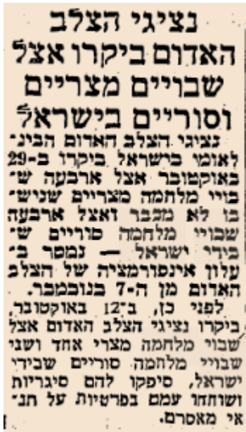
ידיעה מעיתון "דבר" מיום 13 בנובמבר 1969, המלמדת על כיבוד דיני השבי בידי מדינת ישראל